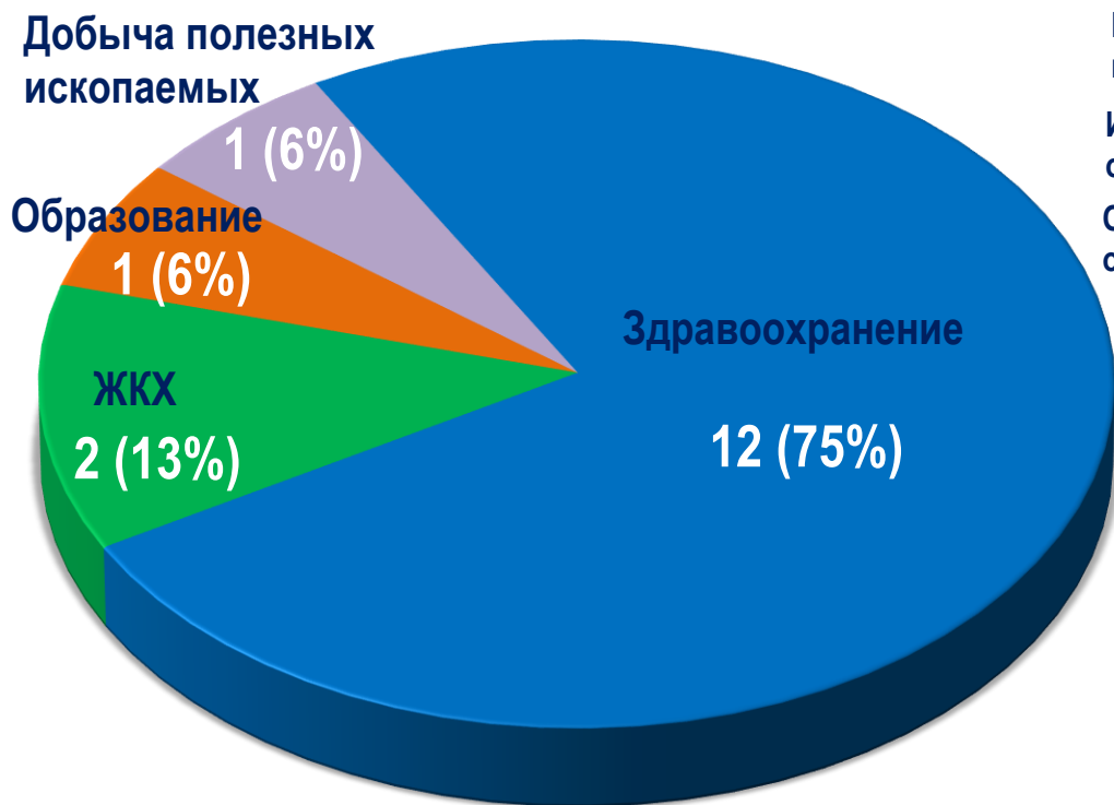
Диаграмма 4. Распределение актуальных СТК по отраслям