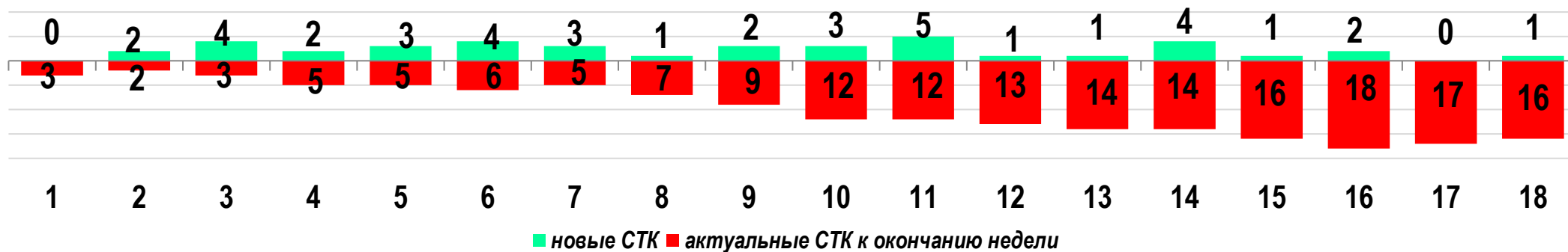
Диаграмма 1. Динамика распределения СТК в недельном разрезе