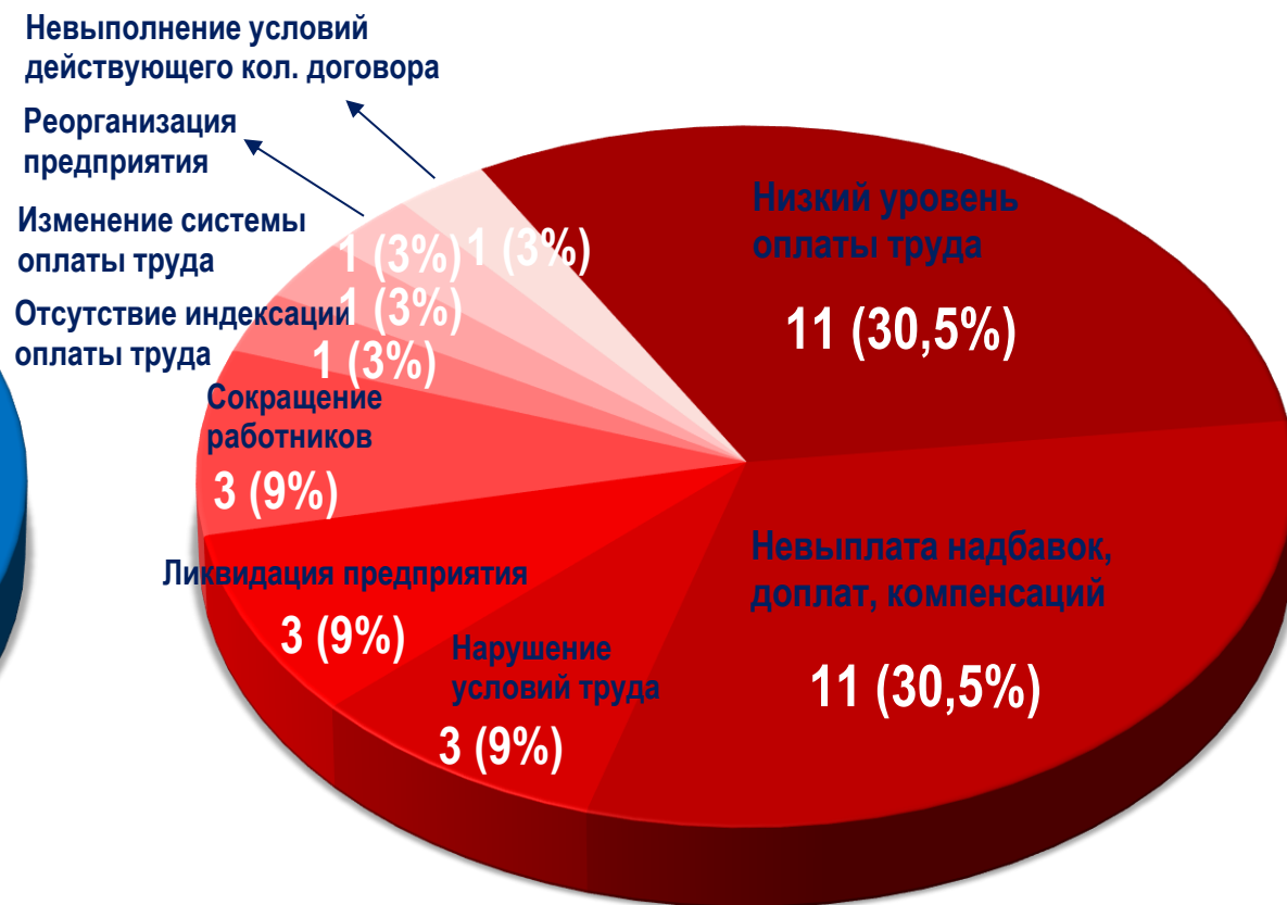
Диаграмма 5. Причины актуальных СТК за истекшую неделю 1