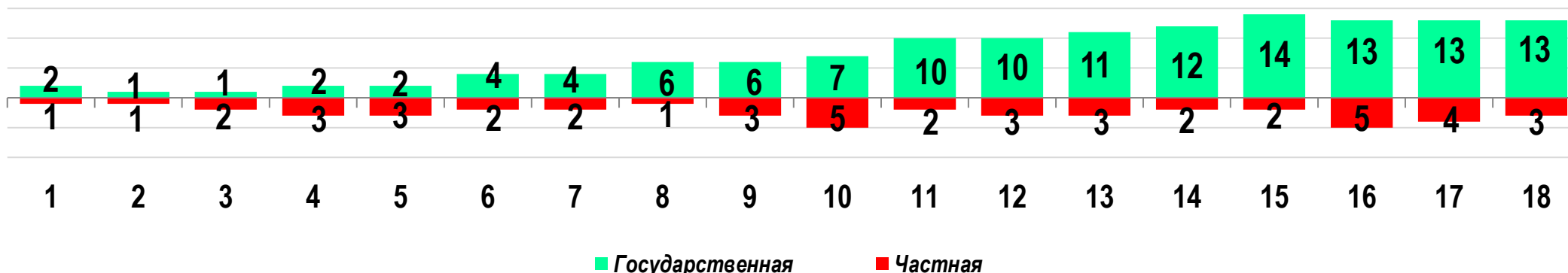
Диаграмма 3. Динамика распределения СТК по формам собственности предприятий (учреждений)