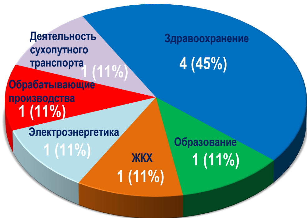
Диаграмма 4. Распределение актуальных СТК по отраслям