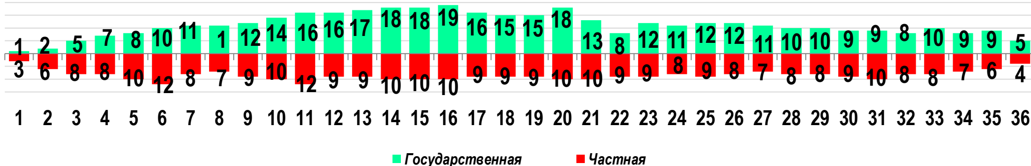
Диаграмма 3. Динамика распределения СТК по формам собственности предприятий (учреждений)