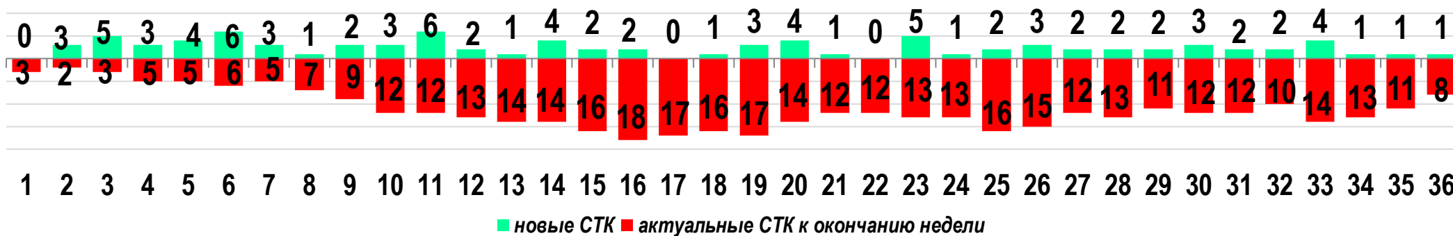
Диаграмма 1. Динамика распределения СТК в недельном разрезе