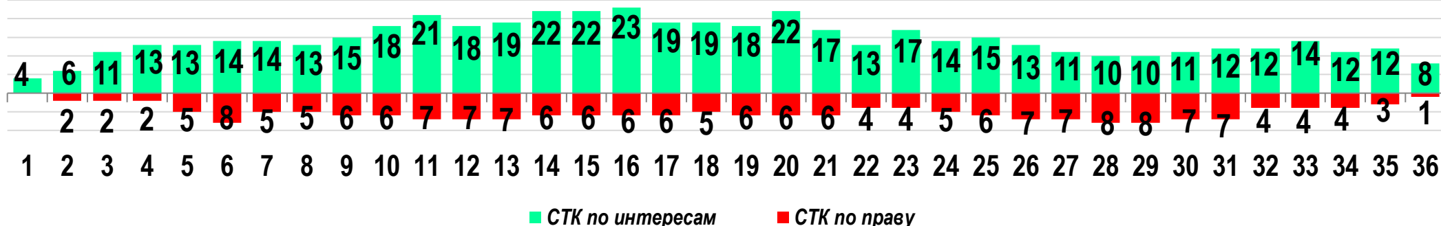
Диаграмма 2. Динамика распределения СТК по юрисдикционной форме