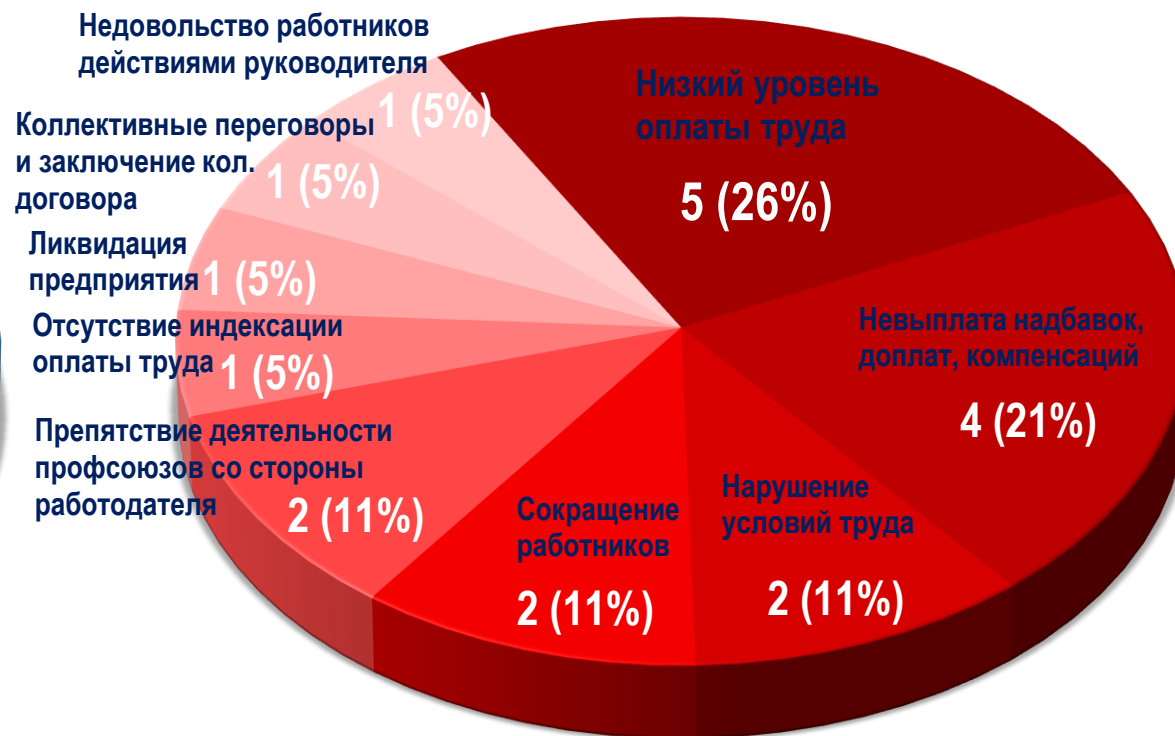
Диаграмма 5. Причины актуальных СТК за истекшую неделю 1