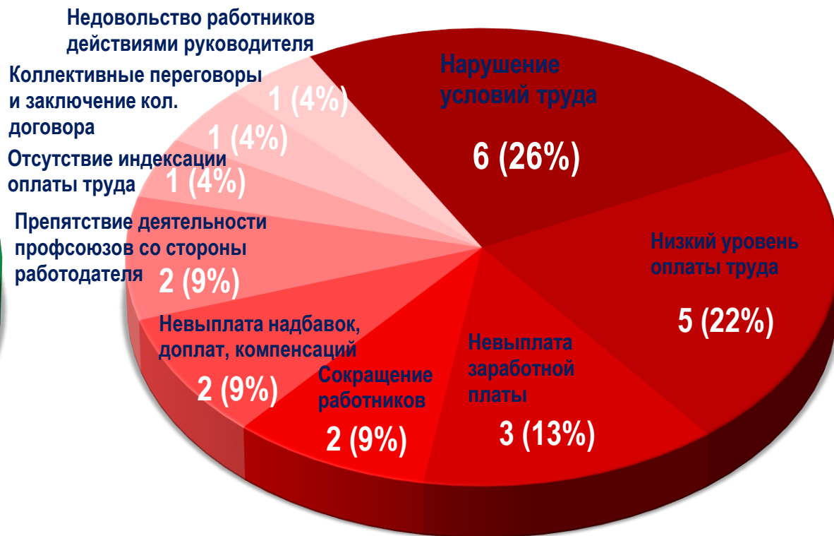
Диаграмма 5. Причины актуальных СТК за истекшую неделю 1