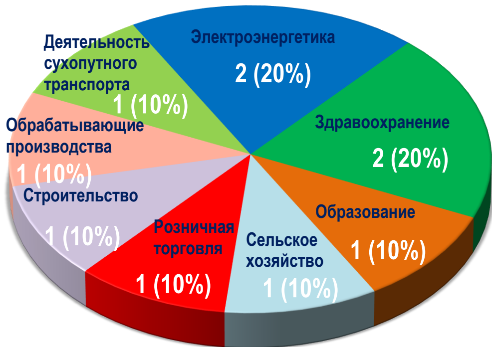
Диаграмма 4. Распределение актуальных СТК по отраслям