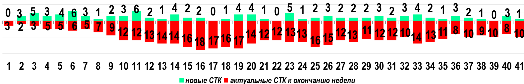
Диаграмма 1. Динамика распределения СТК в недельном разрезе