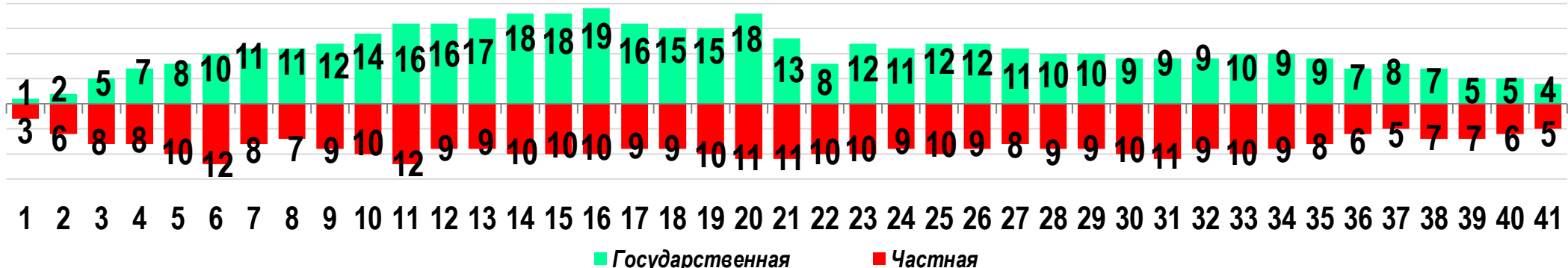
Диаграмма 3. Динамика распределения СТК по формам собственности предприятий (учреждений)