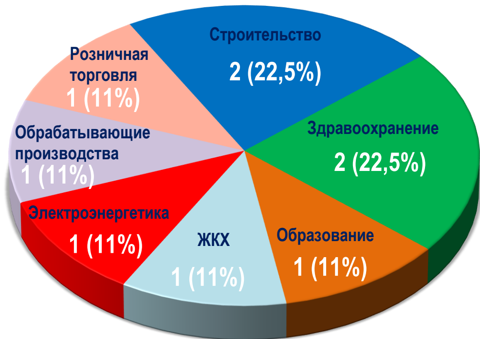
Диаграмма 4. Распределение актуальных СТК по отраслям