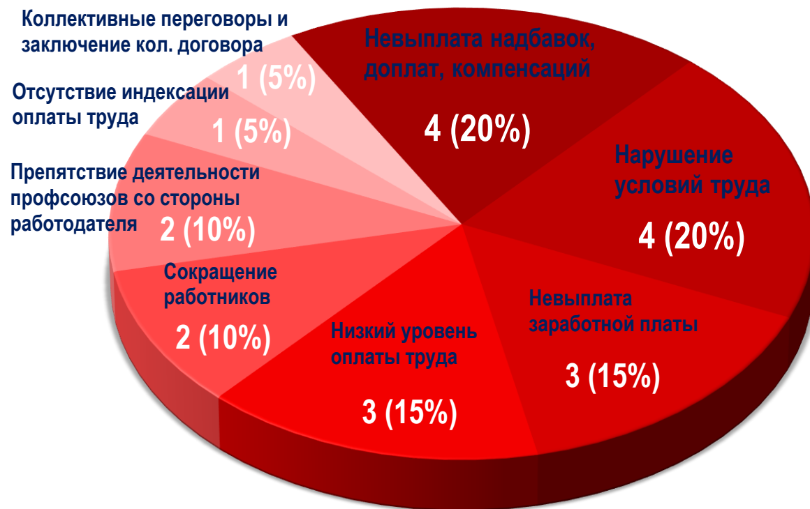
Диаграмма 5. Причины актуальных СТК за истекшую неделю 1