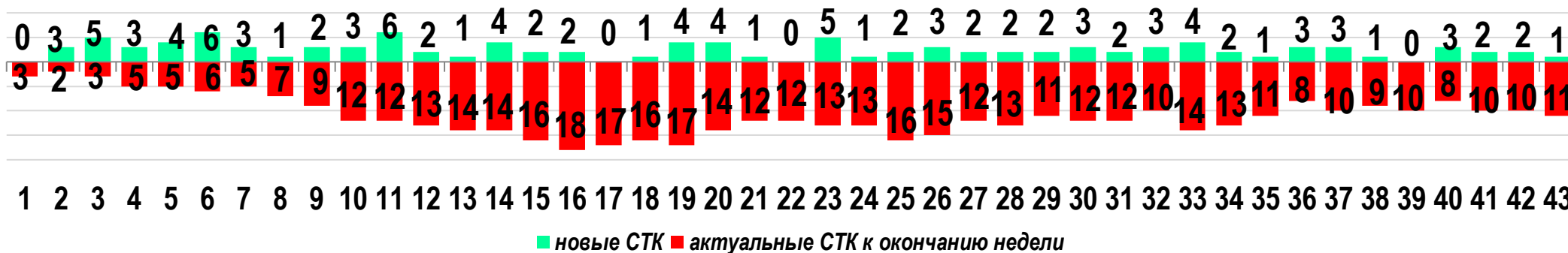
Диаграмма 1. Динамика распределения СТК в недельном разрезе