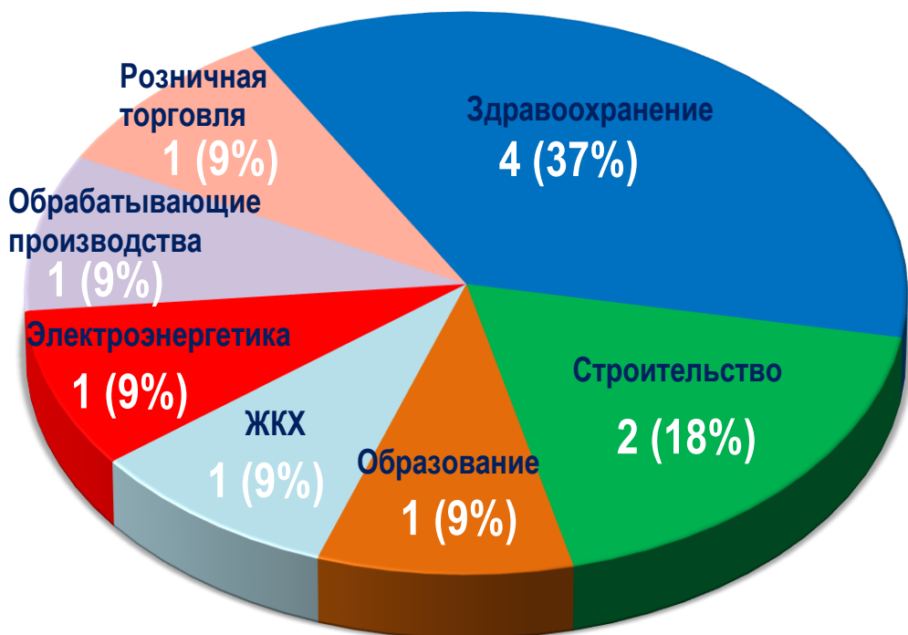
Диаграмма 4. Распределение актуальных СТК по отраслям