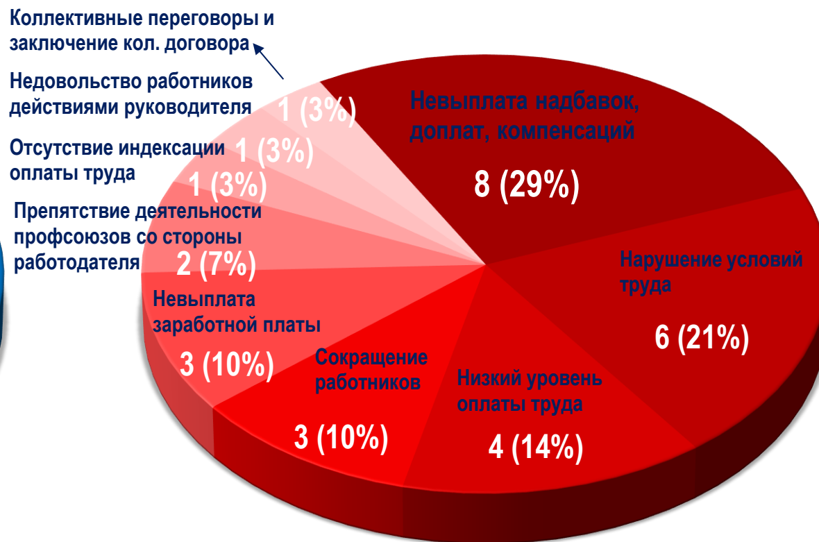
Диаграмма 5. Причины актуальных СТК за истекшую неделю 1