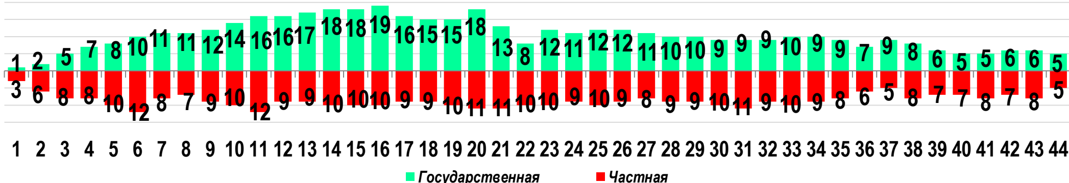
Диаграмма 3. Динамика распределения СТК по формам собственности предприятий (учреждений)