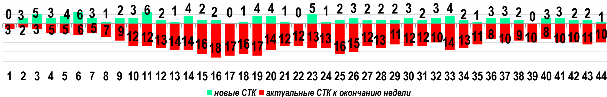
Диаграмма 1. Динамика распределения СТК в недельном разрезе