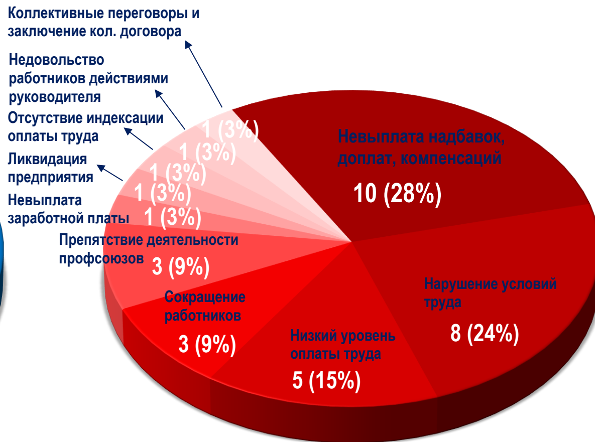
Диаграмма 5. Причины актуальных СТК за истекшую неделю 1