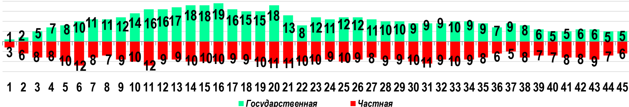
Диаграмма 3. Динамика распределения СТК по формам собственности предприятий (учреждений)