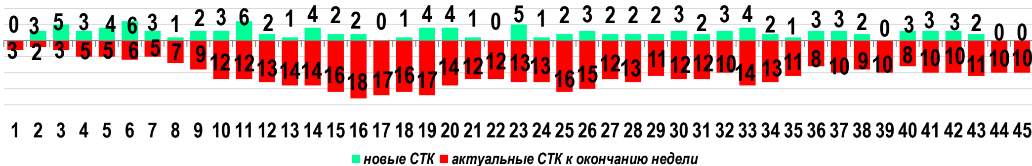
Диаграмма 1. Динамика распределения СТК в недельном разрезе