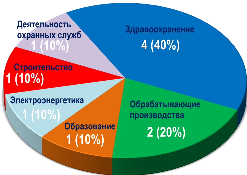
Диаграмма 4. Распределение актуальных СТК по отраслям