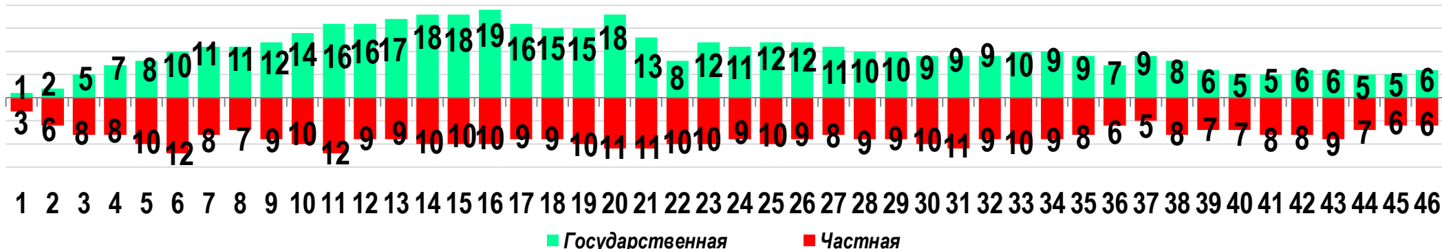
Диаграмма 3. Динамика распределения СТК по формам собственности предприятий (учреждений)