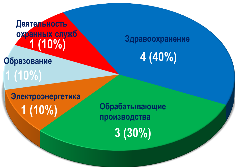
Диаграмма 4. Распределение актуальных СТК по отраслям