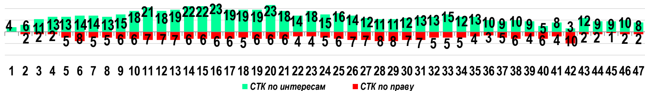
Диаграмма 2. Динамика распределения СТК по юрисдикционной форме