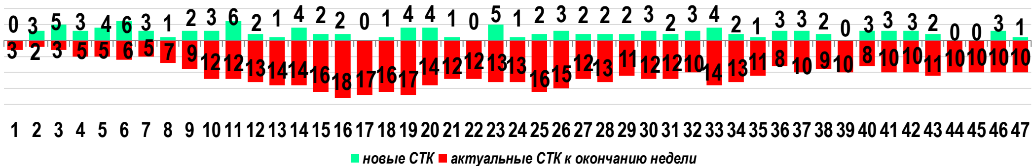
Диаграмма 1. Динамика распределения СТК в недельном разрезе