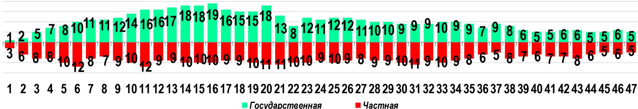
Диаграмма 3. Динамика распределения СТК по формам собственности предприятий (учреждений)