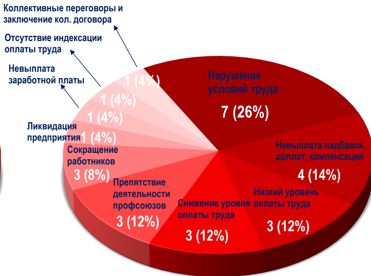
Диаграмма 5. Причины актуальных СТК за истекшую неделю 1