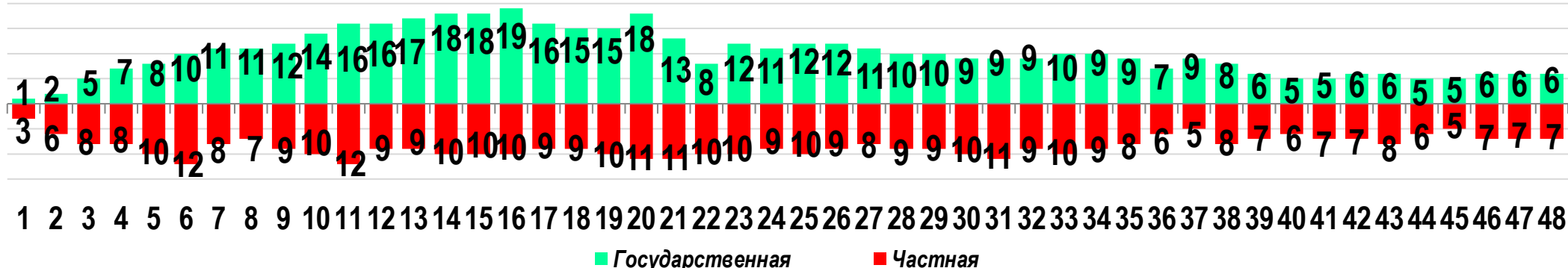
Диаграмма 3. Динамика распределения СТК по формам собственности предприятий (учреждений)