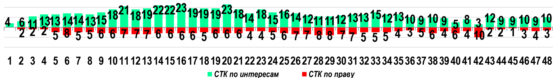
Диаграмма 2. Динамика распределения СТК по юрисдикционной форме