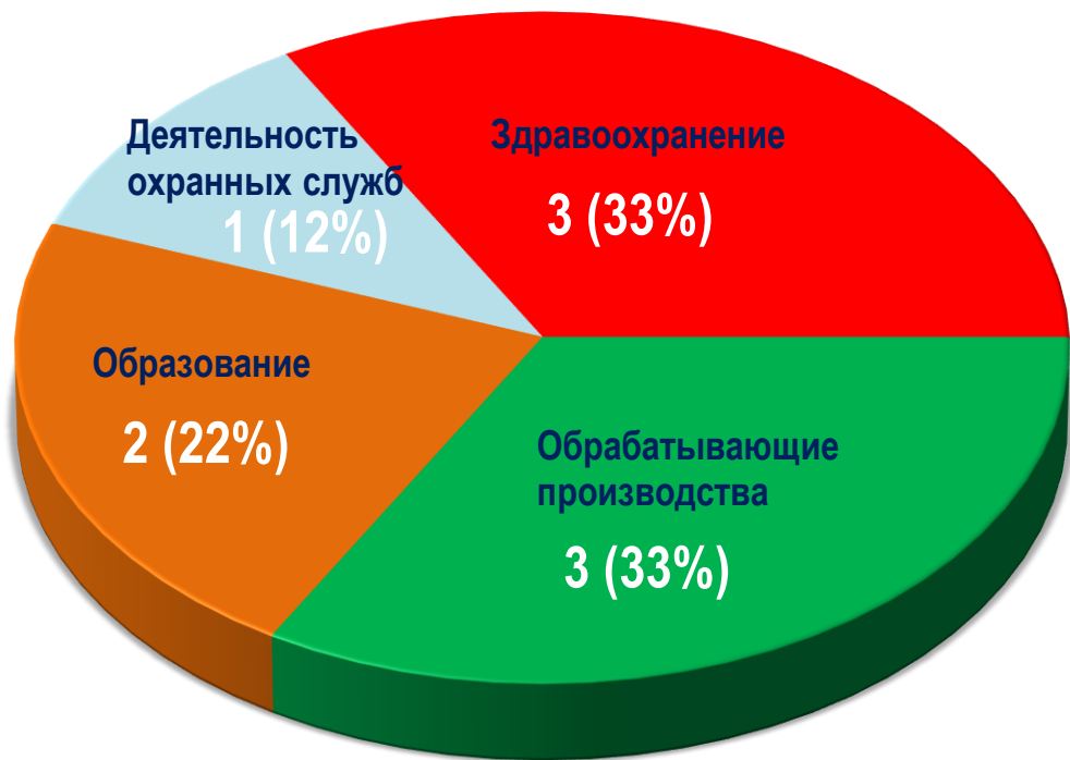
Диаграмма 4. Распределение актуальных СТК по отраслям