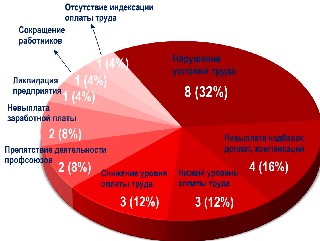
Диаграмма 5. Причины актуальных СТК за истекшую неделю 1