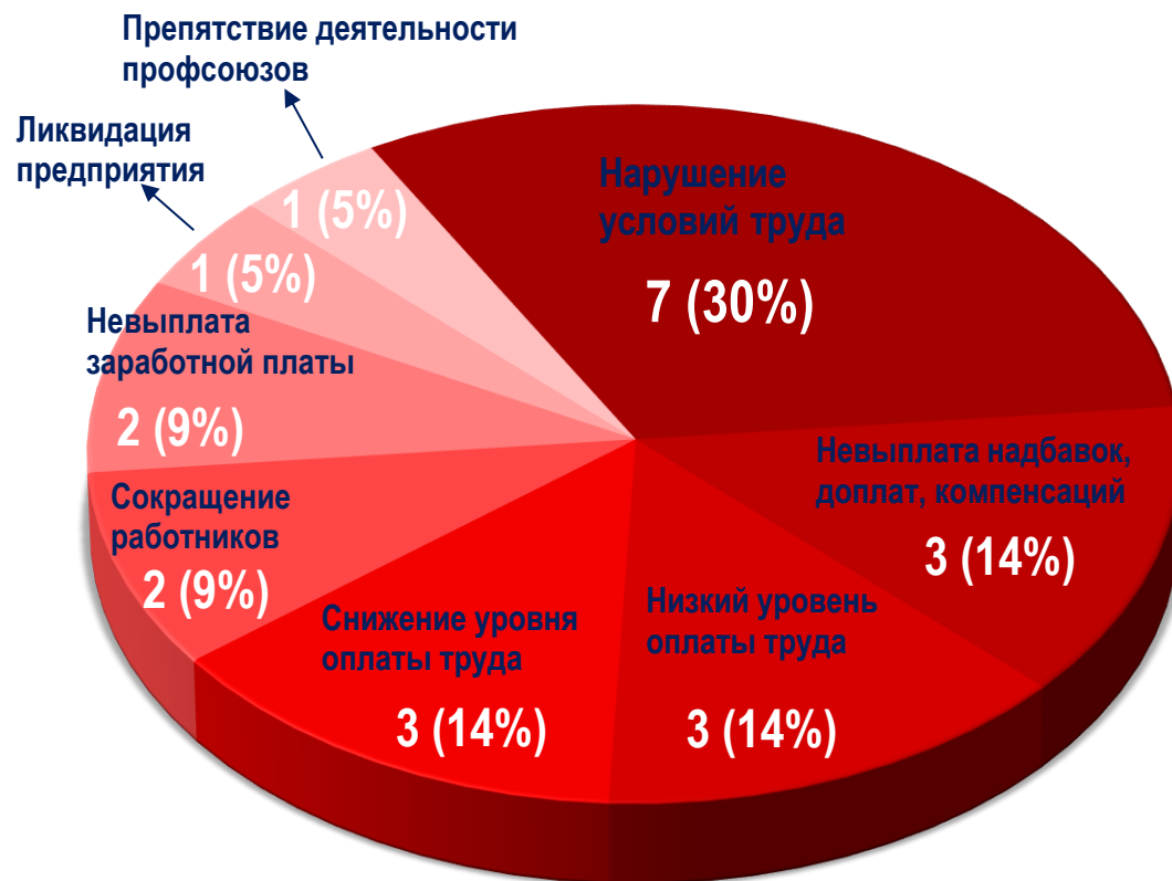
Диаграмма 5. Причины актуальных СТК за истекшую неделю 1