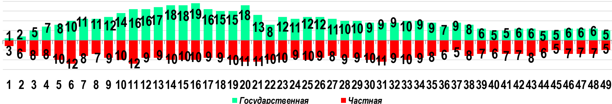
Диаграмма 3. Динамика распределения СТК по формам собственности предприятий (учреждений)