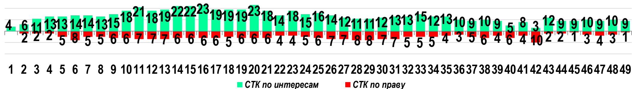
Диаграмма 2. Динамика распределения СТК по юрисдикционной форме