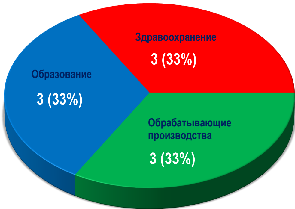
Диаграмма 4. Распределение актуальных СТК по отраслям