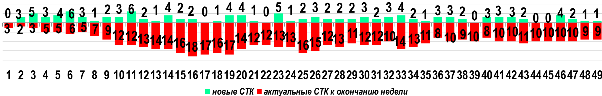
Диаграмма 1. Динамика распределения СТК в недельном разрезе