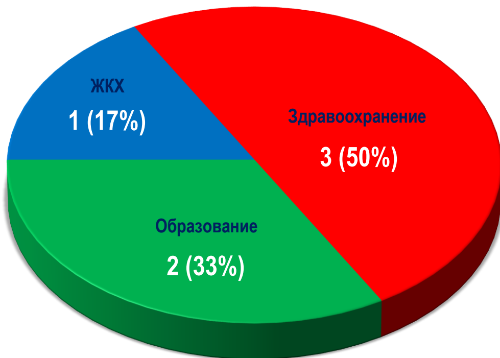
Диаграмма 1. Распределение актуальных СТК по отраслям