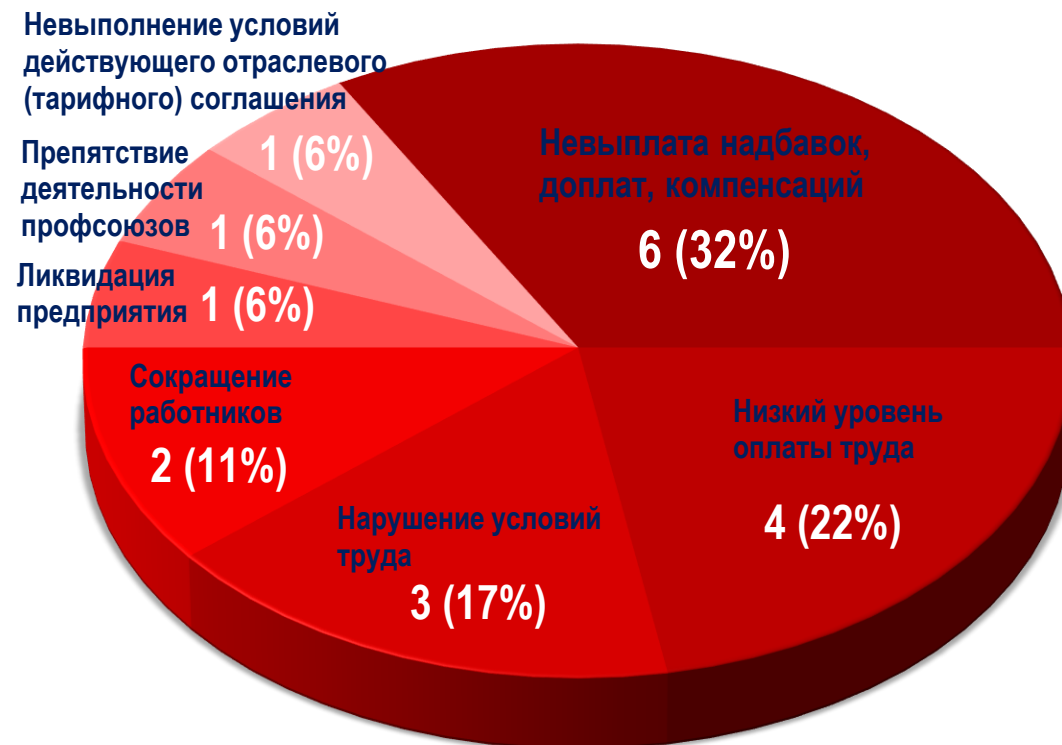
Диаграмма 2. Причины актуальных СТК за истекшую неделю 1