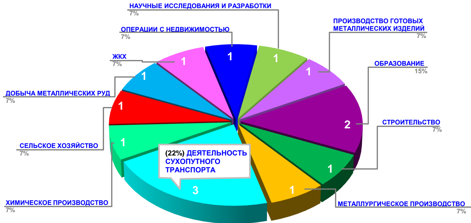
Диаграмма 2. Распределение актуальных социально-трудовых конфликтов по отраслям в РФ за истекшую неделю