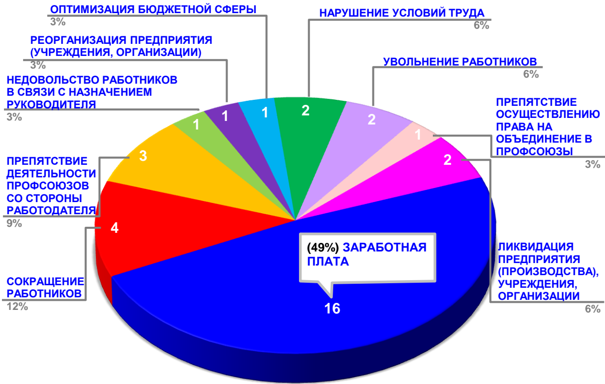
Диаграмма 3. Причины актуальных социально-трудовых конфликтов в РФ за истекшую неделю 1