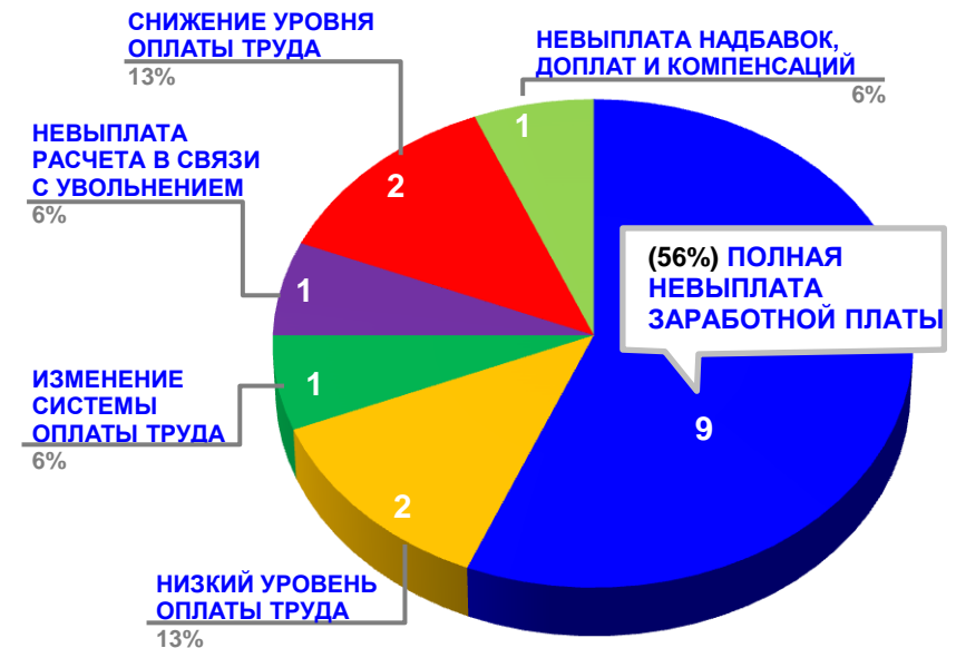
Диаграмма 4. Причины актуальных социально-трудовых конфликтов (разбивка по заработной плате)