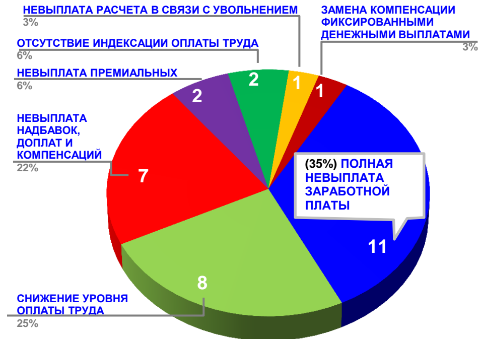
Диаграмма 4. Причины актуальных социально-трудовых конфликтов (разбивка по заработной плате)