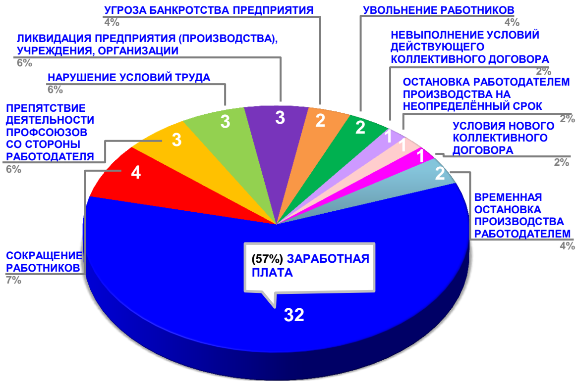
Диаграмма 3. Причины актуальных социально-трудовых конфликтов в РФ за истекшую неделю 1