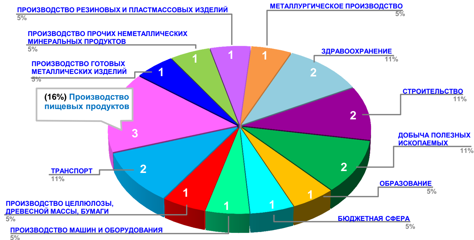
Диаграмма 2. Распределение актуальных социально-трудовых конфликтов по отраслям в РФ за истекшую неделю