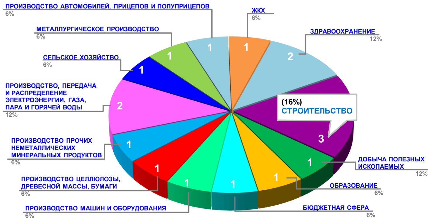
Диаграмма 2. Распределение актуальных социально-трудовых конфликтов по отраслям в РФ за истекшую неделю