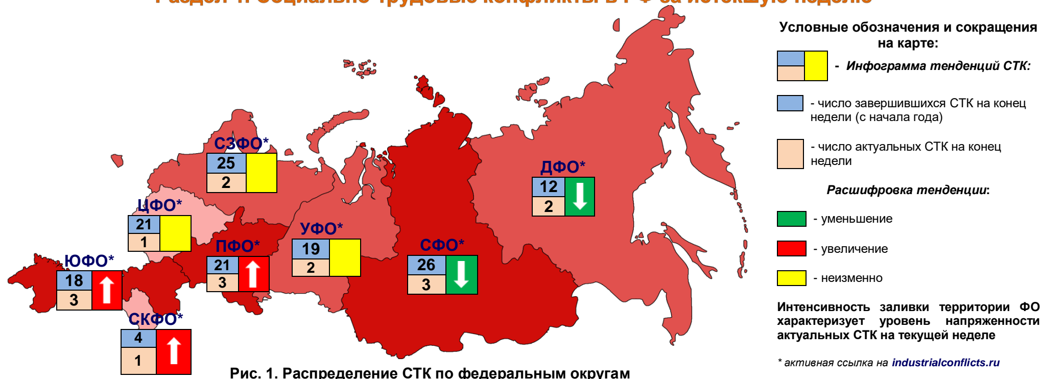
Рис. 1. Распределение СТК по федеральным округам

По состоянию на 24.12.17 на территории РФ актуальны 17 социально-трудовых конфликтов (СТК), которые развиваются в восьми федеральных округах, из них 4 СТК в моногородах: ОАО «ДААЗ» (г. Димитровград, Ульяновская обл., ПФО), ООО «Кингкоул Юг» (г.Гуково, Ростовская обл., ЮФО), ООО «Лермонтовский ГОК» (п.Светлогорье, Приморский край, ДФО), ОАО «НПК Уралвагонзавод» (г.Нижний Тагил, Свердловская обл., УФО). Распределение СТК по ФО отображено на рис.1. В наблюдаемом периоде зарегистрированы новые СТК в ЮФО, СКФО и ПФО (разделы 4, 7). Впервые за последние семь месяцев СТК происходят во всех ФО без исключения. В моногороде второй категории Димитровград (Ульяновская обл., ПФО) на автоагрегатном заводе около 70 работников объявили забастовку из-за низкой температуры в производственных цехах. Акция протеста длилась один день ( www.industrialconflicts.ru ). В республике Крым (ЮФО) около 100 коммунальщиков симферопольского муниципального предприятия «Экоград» вышли на несанкционированную акцию протеста к зданию городской администрации против увольнения руководителя и против дестабилизации ситуации в МУПе, работа которого в данный момент парализована ( www.industrialconflicts.ru ). В городе Прохладный Кабардино-Балкарской республики (СКФО) работники обанкротившегося АО «Кавказкабель», не получающие зарплату, направили обращение Президенту РФ с просьбой спасти предприятие. Профсоюзный комитет предприятия уведомлен о сокращении 652 работников ( www.industrialconflicts.ru ).