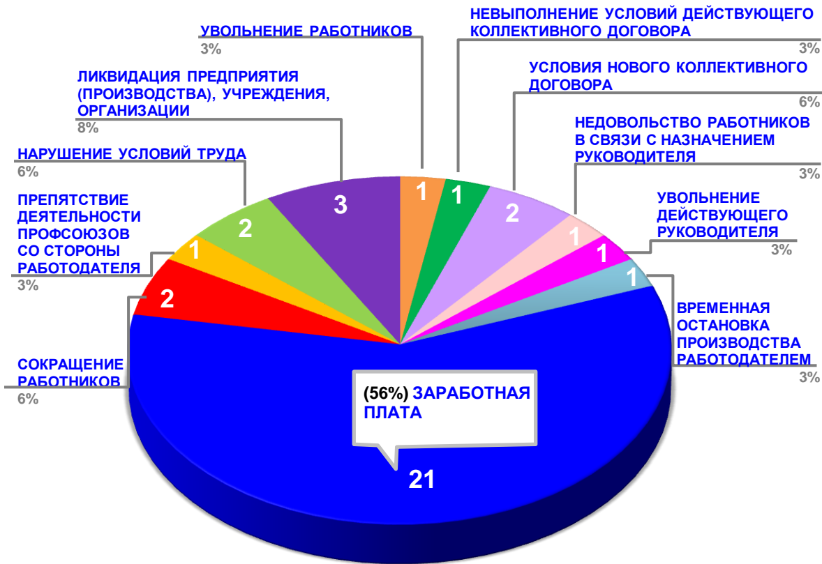
Диаграмма 3. Причины актуальных социально-трудовых конфликтов в РФ за истекшую неделю 1