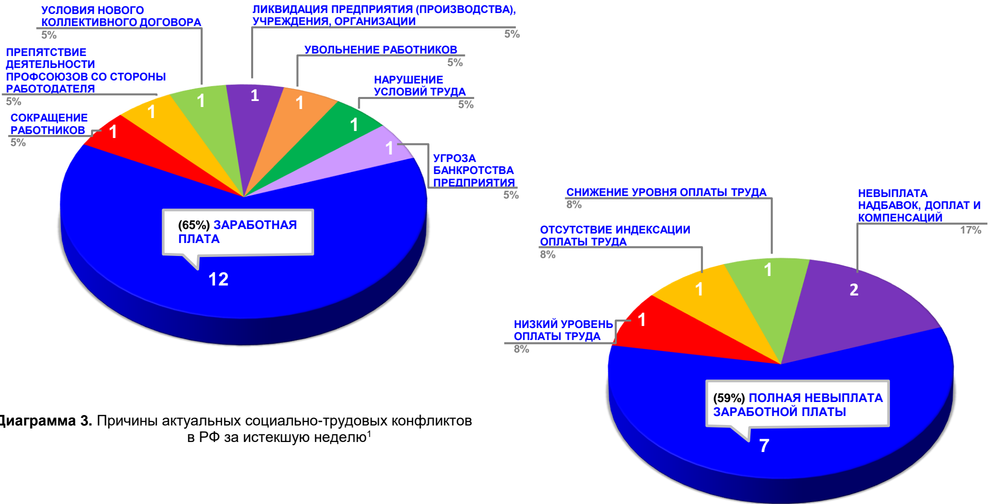
Диаграмма 3. Причины актуальных социально-трудовых конфликтов в РФ за истекшую неделю 1