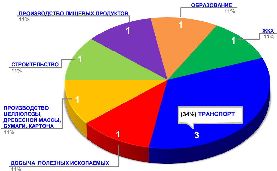
Диаграмма 2. Распределение актуальных социально-трудовых конфликтов по отраслям в РФ за истекшую неделю