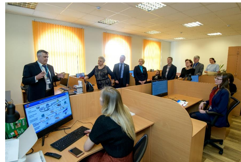
Участники конференции посещают Центр мониторинга и анализа трудовых конфликтов