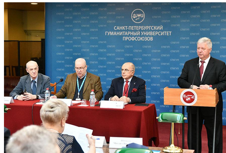
Председатель ФНПР М. Шмаков выступает на открытии форума