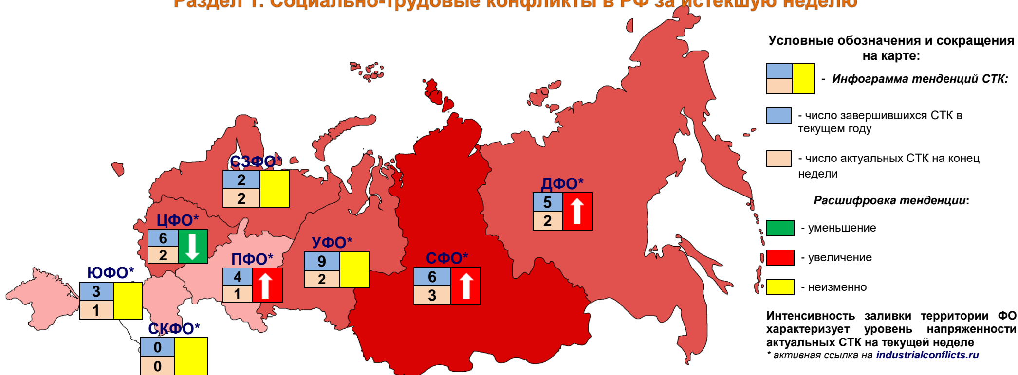
Рис. 1. Распределение СТК по федеральным округам