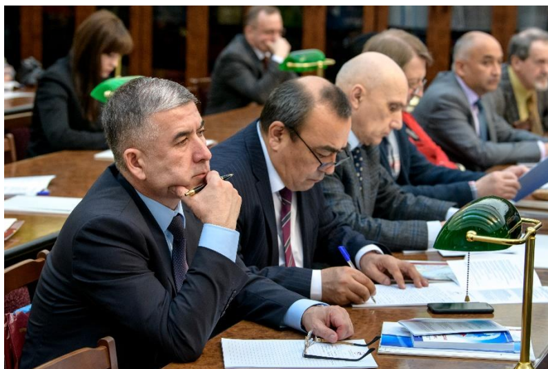
В пленарном заседании принимают участие лидеры профсоюзов стран СНГ