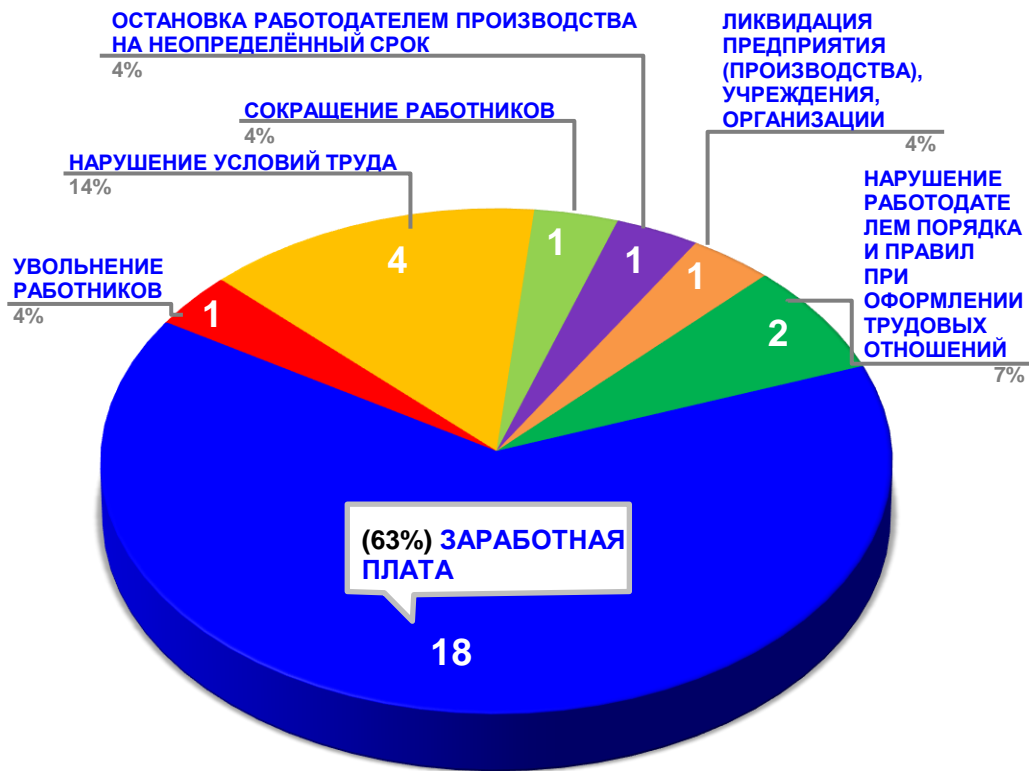
Диаграмма 3. Причины актуальных социально-трудовых конфликтов в РФ за истекшую неделю 1