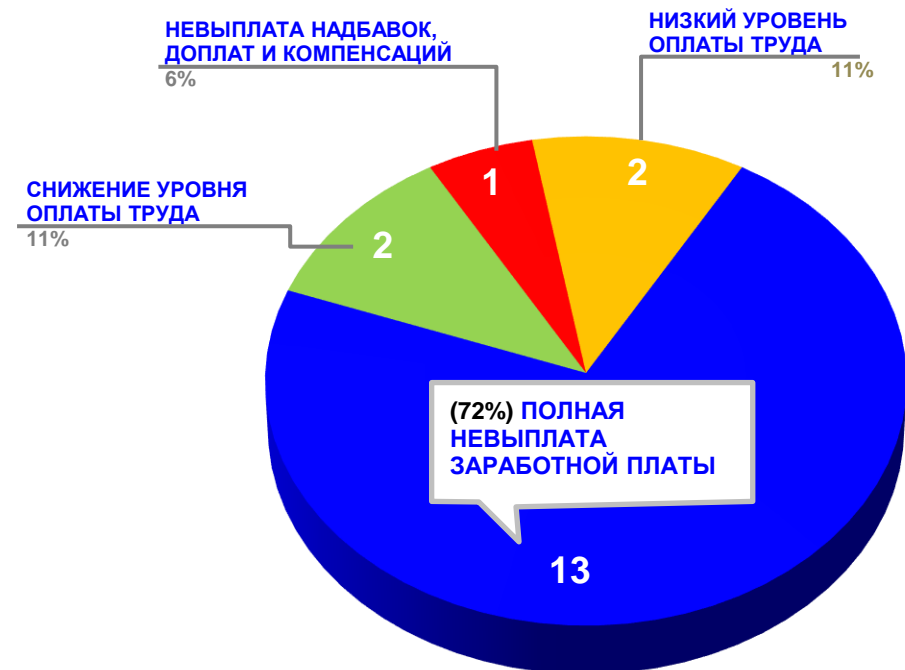
Диаграмма 4. Причины актуальных социально-трудовых конфликтов (разбивка по заработной плате)