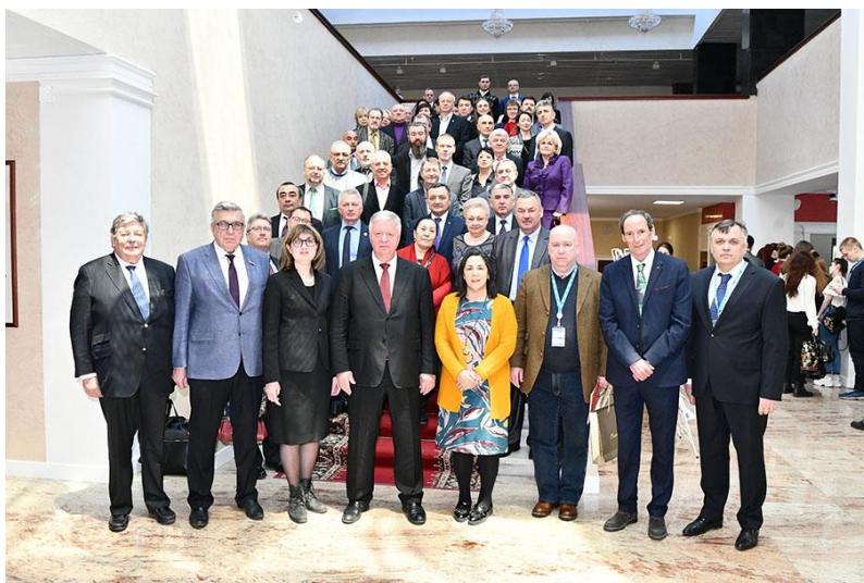
Почётные гости конференции на совместном фотографировании