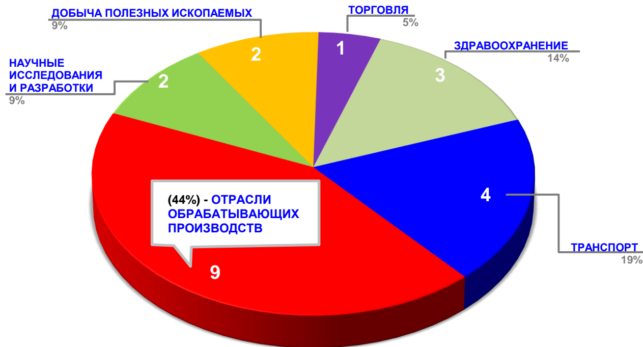
Диаграмма 2. Распределение актуальных социально-трудовых конфликтов по отраслям в РФ за истекшую неделю