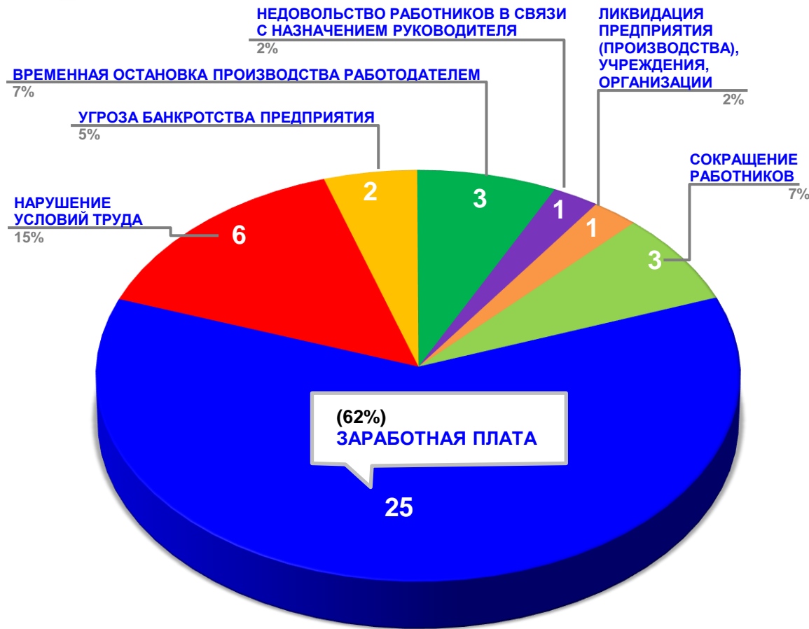
Диаграмма 3. Причины актуальных социально-трудовых конфликтов в РФ за истекшую неделю 1