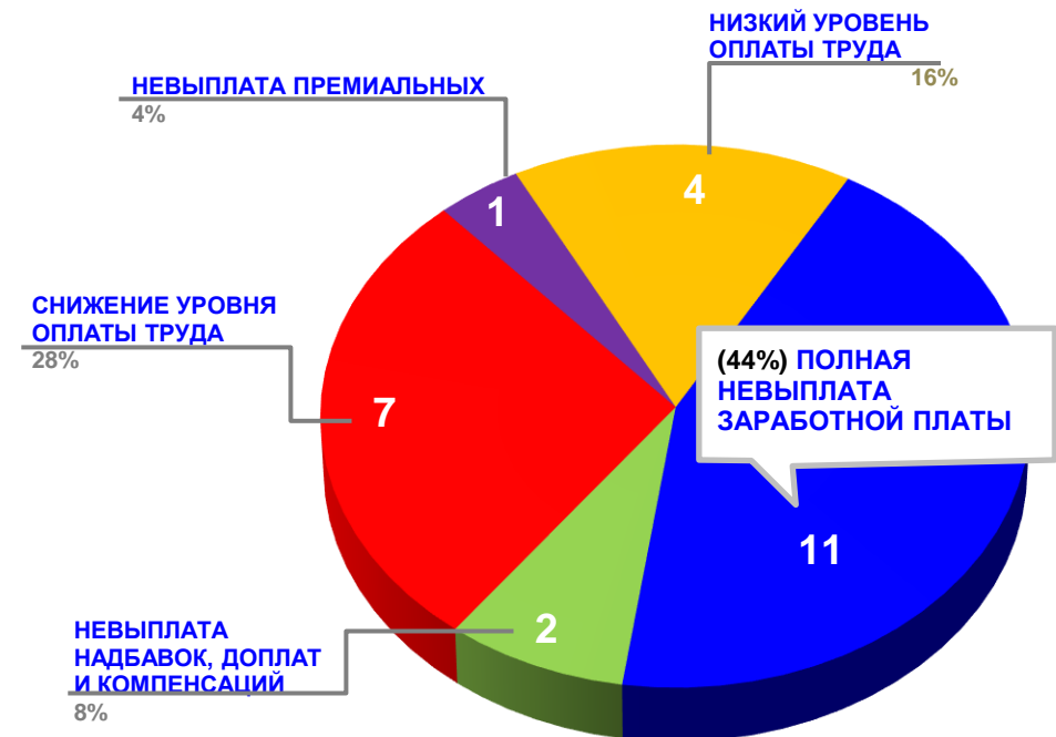
Диаграмма 4. Причины актуальных социально-трудовых конфликтов (разбивка по заработной плате)