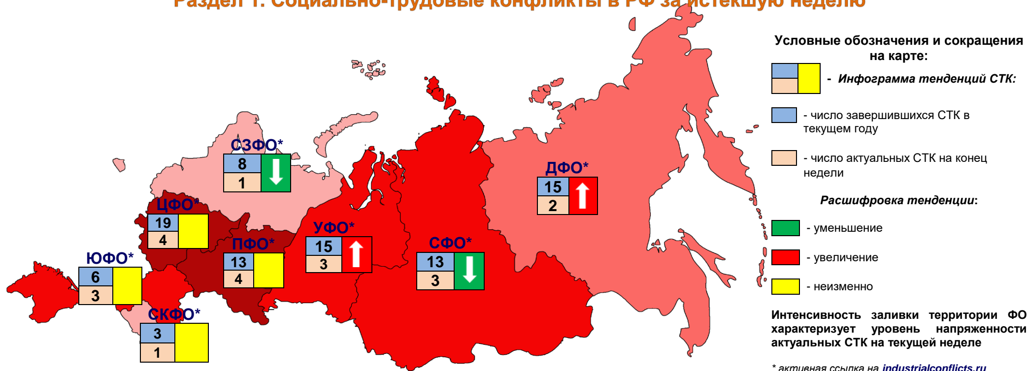
Рис. 1. Распределение СТК по федеральным округам

По состоянию на 21.10.18 на территории РФ актуальны 21 социально-трудовой конфликт (СТК), которые развиваются в восьми федеральных округах, из них 2 СТК в моногородах: ООО «Тейский рудник» (п. Вершина Теи, республика Хакасия, СФО), ООО «Кингоул Юг» (г. Гуково, Ростовская обл., ЮФО). Бывшие работники закрытого АО «Завод МДФ» в Мортке (ХМАО, УФО) вышли на протестный митинг против ликвидации предприятия и его банкротства. В акции приняли участие около 40 человек. Ранее на данном предприятии был зарегистрирован другой СТК, когда работники протестовали за сохранение завода ( www.industrialconflicts.ru ). Во Владивостоке (ДФО) профсоюзы провели пикет за повышение уровня оплаты труда сотрудников и ученых Дальневосточного отделения РАН. Протестующие заявили, что из-за огромного разрыва в оплате труда научных и инженерно-технических работников в трудовых коллективах растет социально-психологическое напряжение. Акция протеста организована Приморской региональной организацией профсоюза работников РАН (ФНПР) ( www.industrialconflicts.ru ). НМЦ «ТК» отмечает, что в наблюдаемом периоде 9 СТК (42%) развиваются на предприятиях, которые проходят различные стадии банкротства.