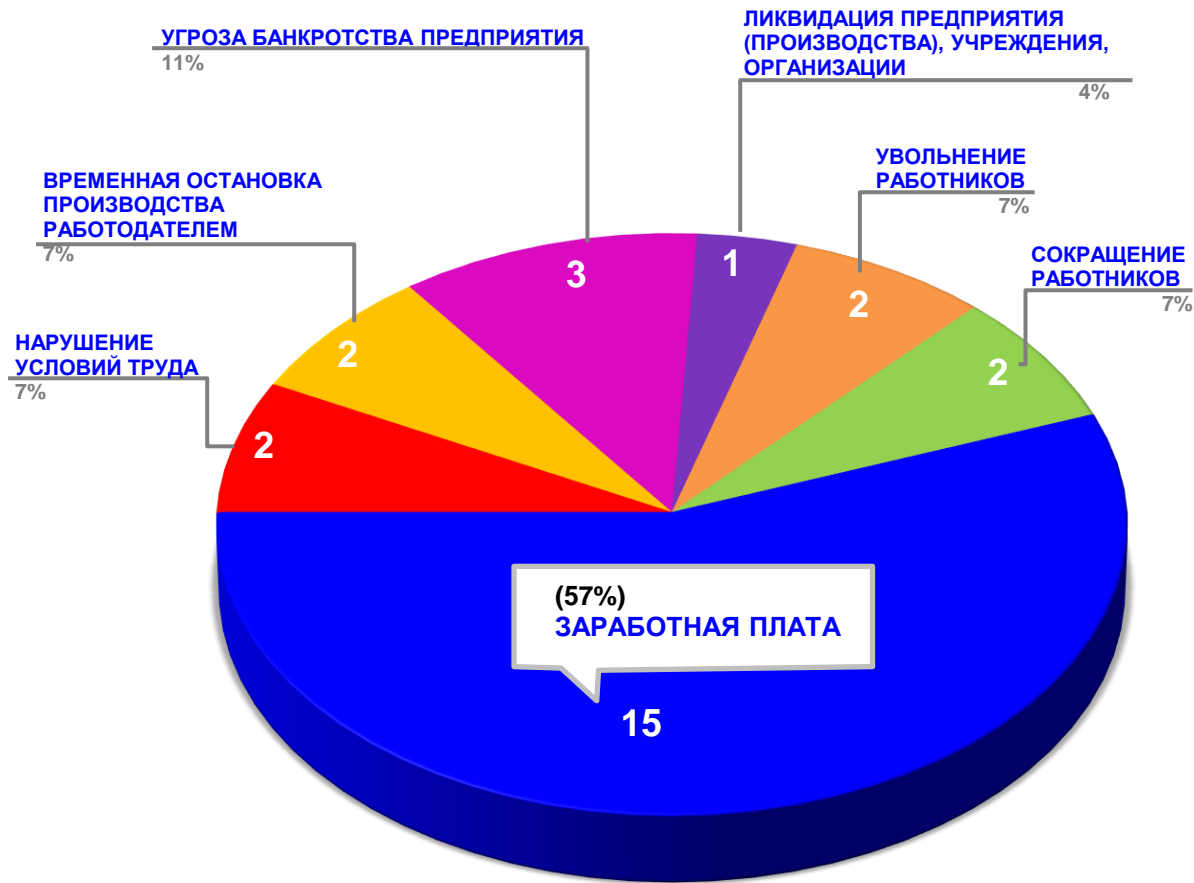
Диаграмма 3. Причины актуальных социально-трудовых конфликтов в РФ за истекшую неделю 1