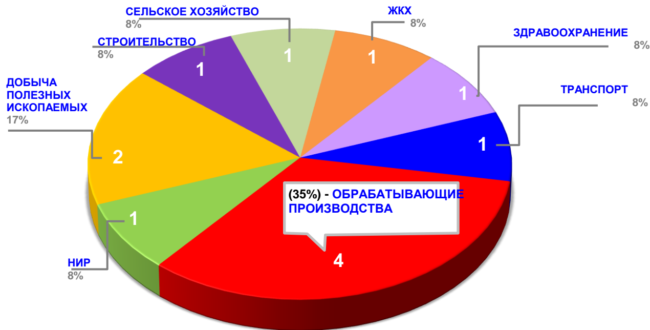
Диаграмма 2. Распределение актуальных социально-трудовых конфликтов по отраслям в РФ за истекшую неделю