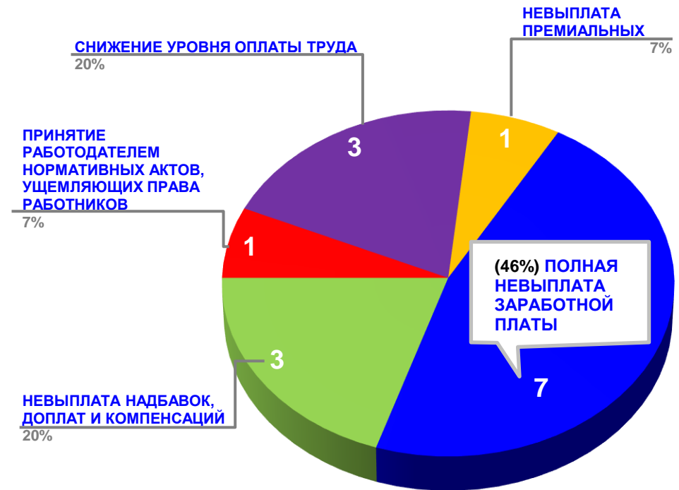
Диаграмма 4. Причины актуальных социально-трудовых конфликтов (разбивка по заработной плате)