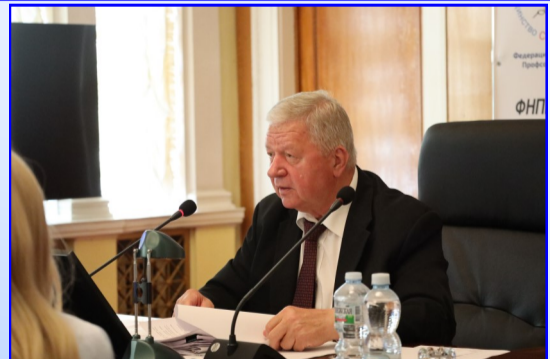
По материалам Центральной профсоюзной газеты России «Солидарность» ©