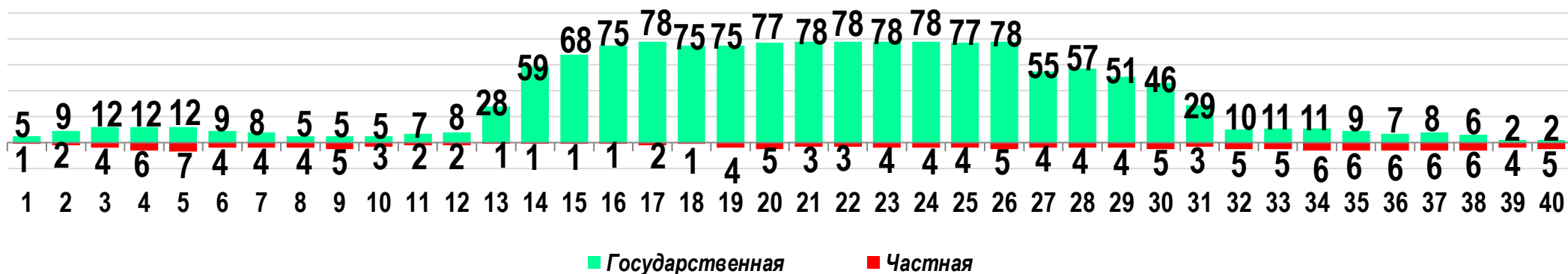
Диаграмма 3. Динамика распределения СТК по формам собственности предприятий (учреждений)