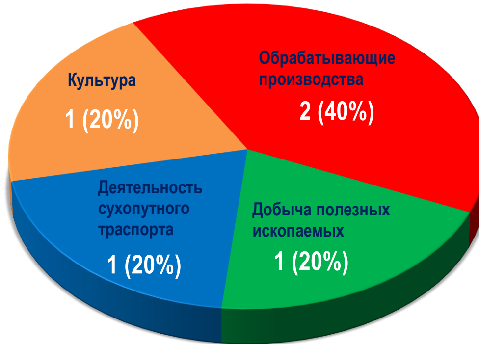
Диаграмма 4. Распределение актуальных СТК по отраслям