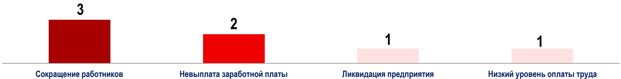
Диаграмма 5. Причины актуальных СТК за истекшую неделю 1