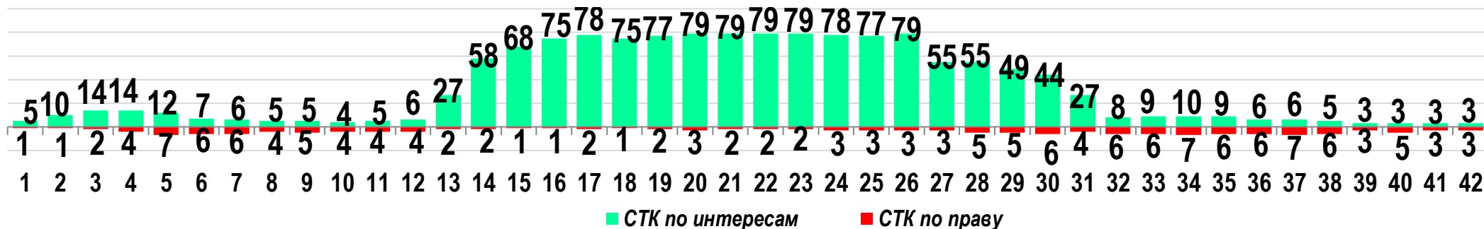
Диаграмма 2. Динамика распределения СТК по юрисдикционной форме