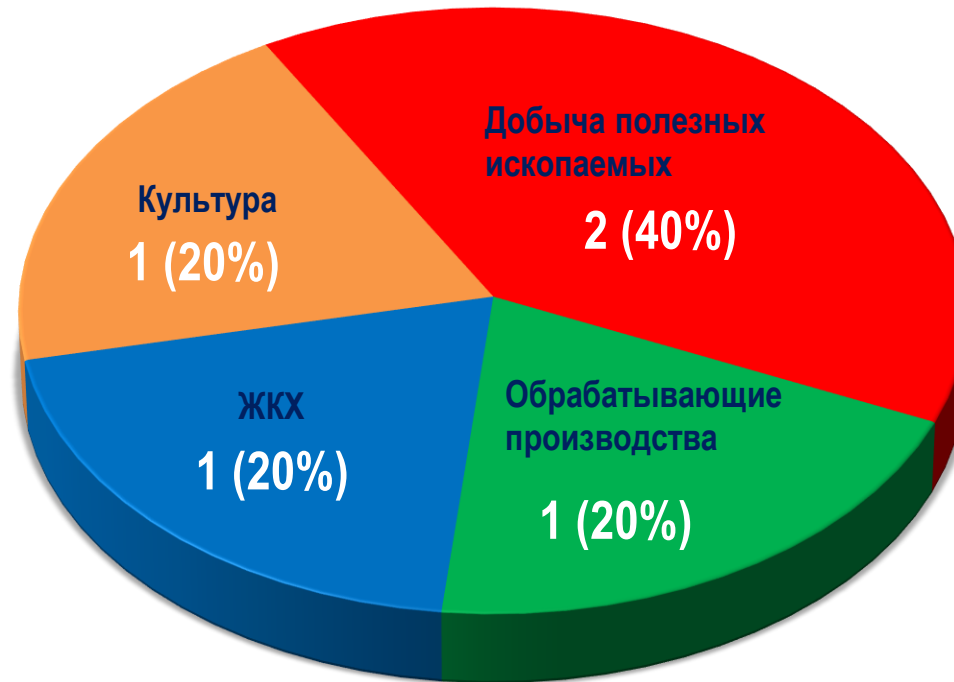
Диаграмма 4. Распределение актуальных СТК по отраслям