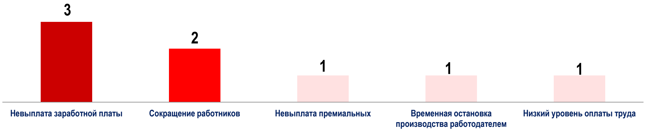
Диаграмма 5. Причины актуальных СТК за истекшую неделю 1