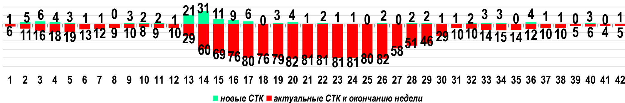
Диаграмма 1. Динамика распределения СТК в недельном разрезе