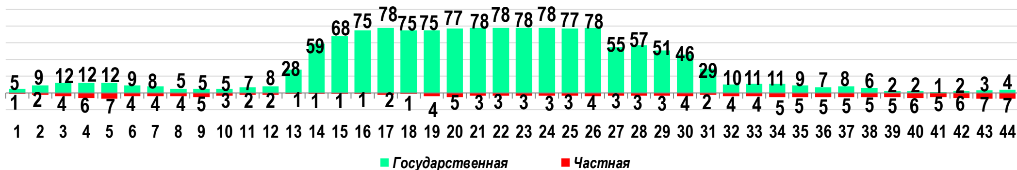
Диаграмма 3. Динамика распределения СТК по формам собственности предприятий (учреждений)