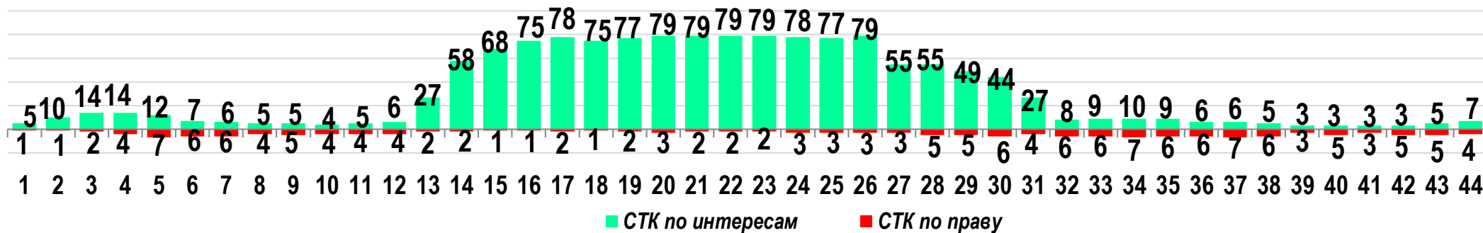
Диаграмма 2. Динамика распределения СТК по юрисдикционной форме