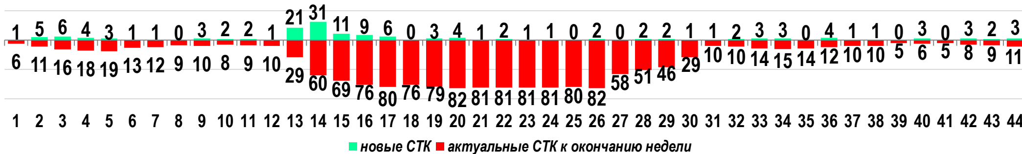
Диаграмма 1. Динамика распределения СТК в недельном разрезе