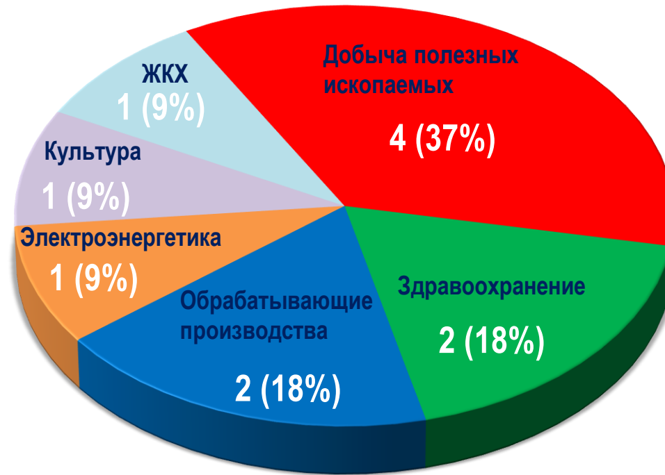
Диаграмма 4. Распределение актуальных СТК по отраслям