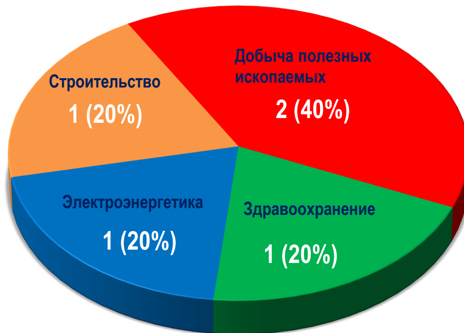
Диаграмма 1. Распределение актуальных СТК по отраслям