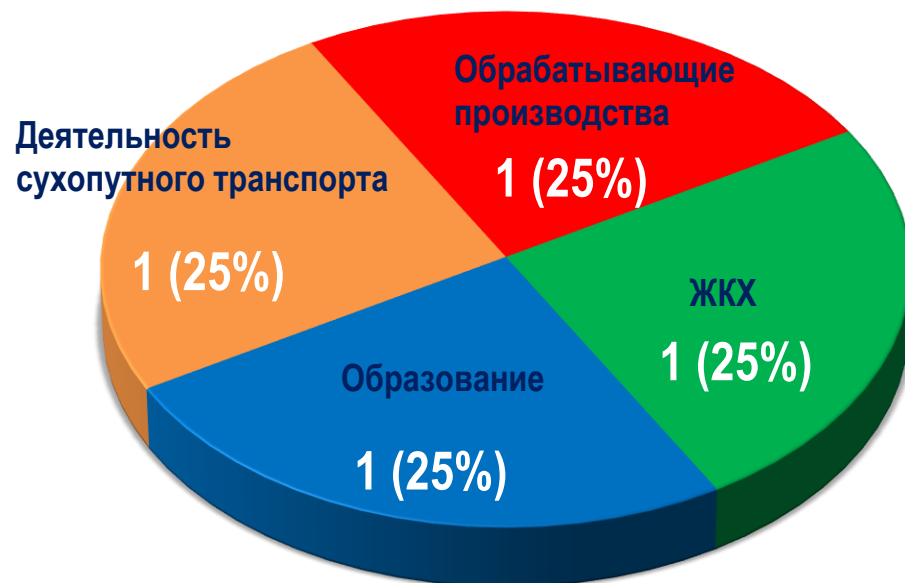
Диаграмма 1. Распределение актуальных СТК по отраслям