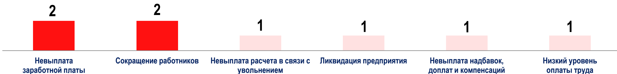
Диаграмма 2. Причины актуальных СТК за истекшую неделю 1