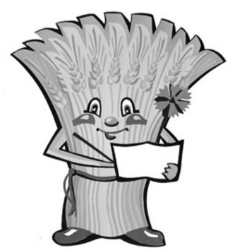
ВСЕРОССИЙСКАЯ СЕЛЬСКОХОЗЯЙСТВЕННАЯ ПЕРЕПИСЬ 2016