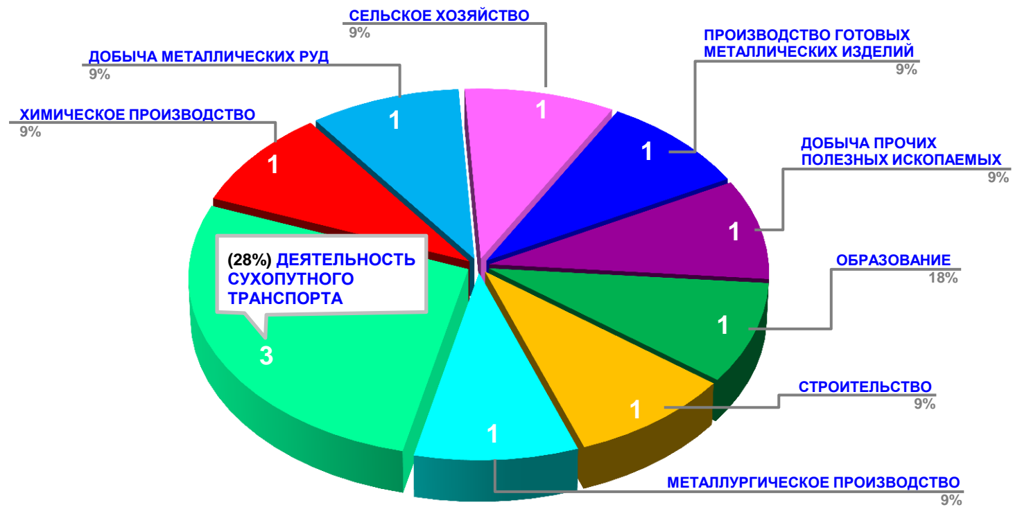
Диаграмма 2. Распределение актуальных социально-трудовых конфликтов по отраслям в РФ за истекшую неделю