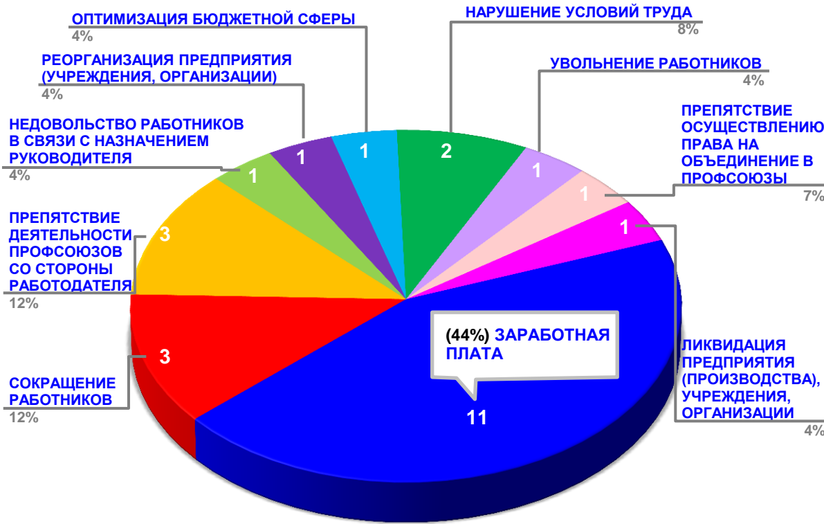
Диаграмма 3. Причины актуальных социально-трудовых конфликтов в РФ за истекшую неделю 1