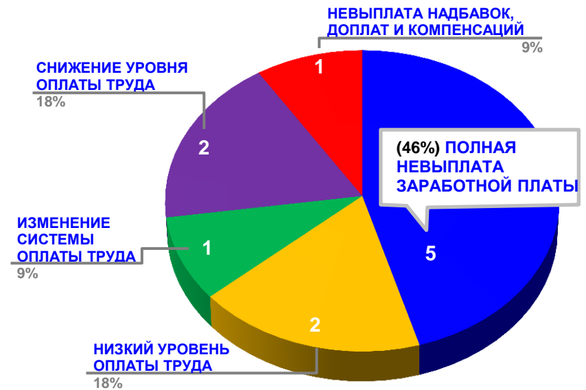
Диаграмма 4. Причины актуальных социально-трудовых конфликтов (разбивка по заработной плате)