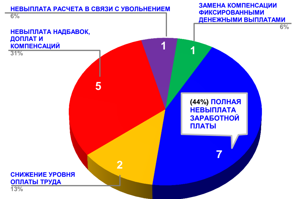
Диаграмма 4. Причины актуальных социально-трудовых конфликтов (разбивка по заработной плате)