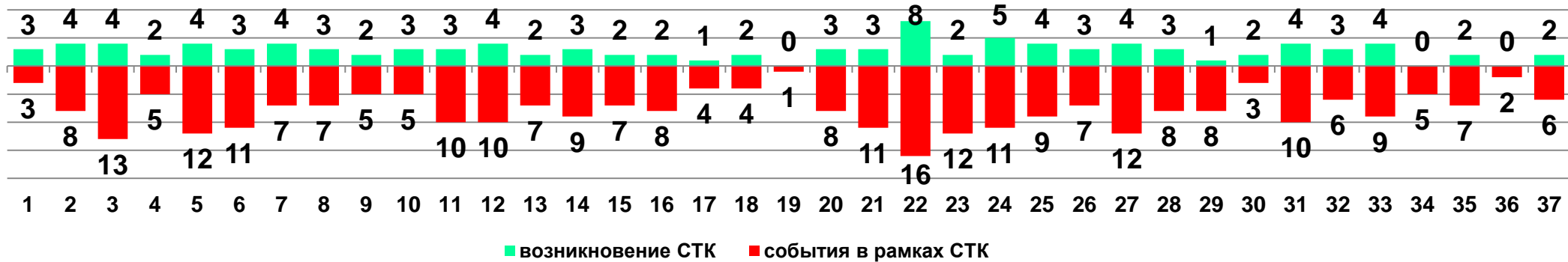
Диаграмма 1. Динамика возникновения и развития социально-трудовых конфликтов в 2017 году в недельном разрезе