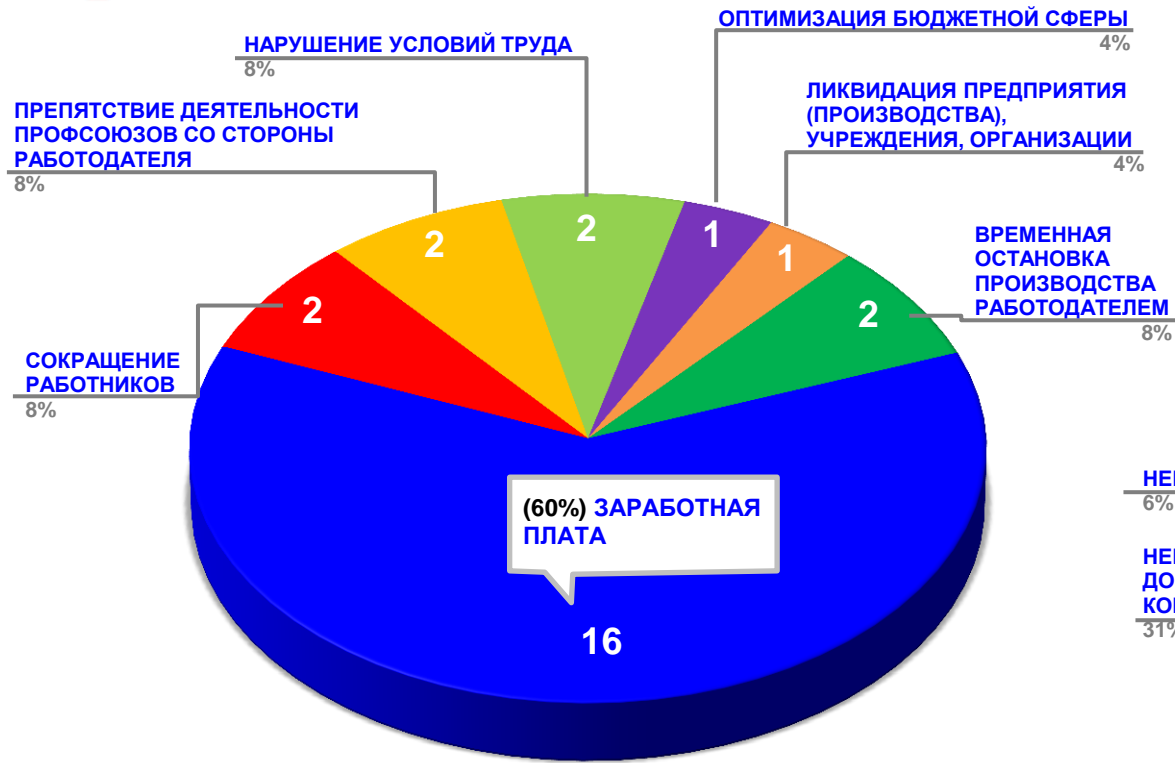
Диаграмма 3. Причины актуальных социально-трудовых конфликтов в РФ за истекшую неделю 1