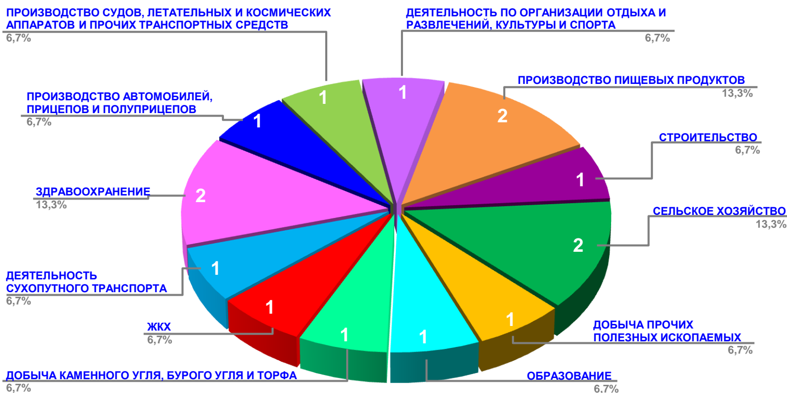
Диаграмма 2. Распределение актуальных социально-трудовых конфликтов по отраслям в РФ за истекшую неделю