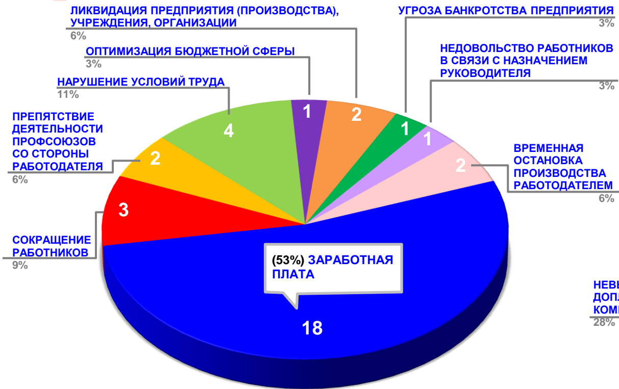
Диаграмма 3. Причины актуальных социально-трудовых конфликтов в РФ за истекшую неделю 1