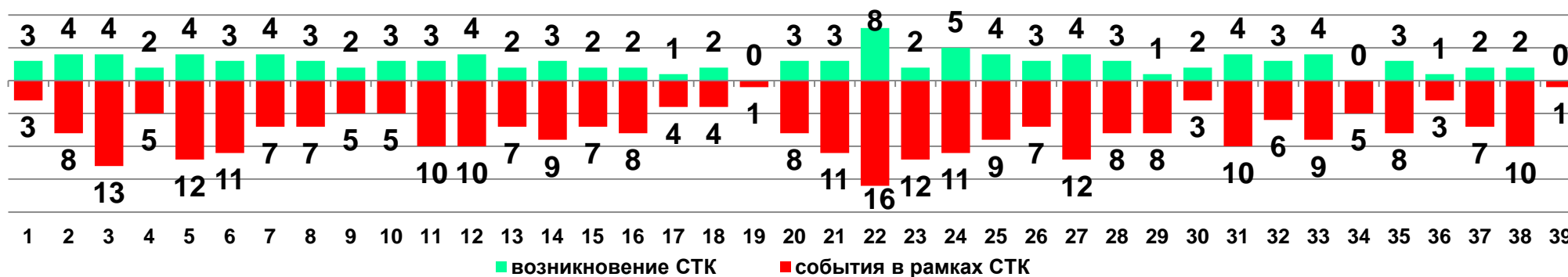
Диаграмма 1. Динамика возникновения и развития социально-трудовых конфликтов в 2017 году в недельном разрезе