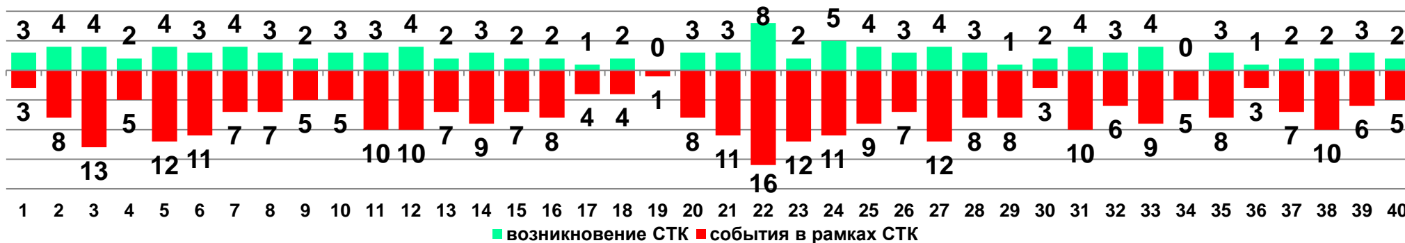
Диаграмма 1. Динамика возникновения и развития социально-трудовых конфликтов в 2017 году в недельном разрезе