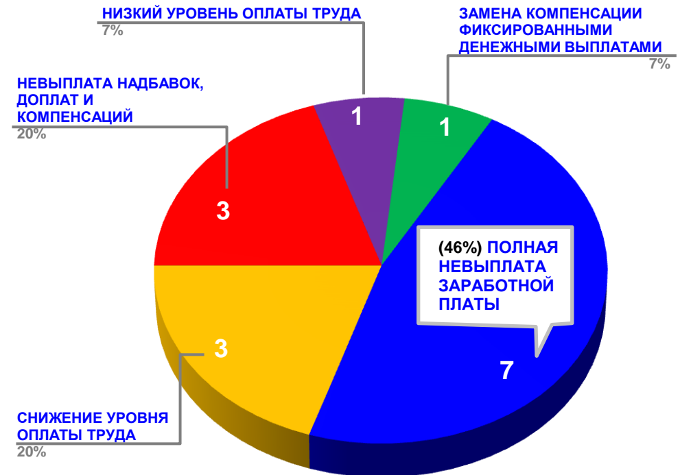
Диаграмма 4. Причины актуальных социально-трудовых конфликтов (разбивка по заработной плате)