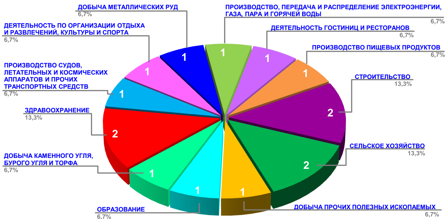
Диаграмма 2. Распределение актуальных социально-трудовых конфликтов по отраслям в РФ за истекшую неделю