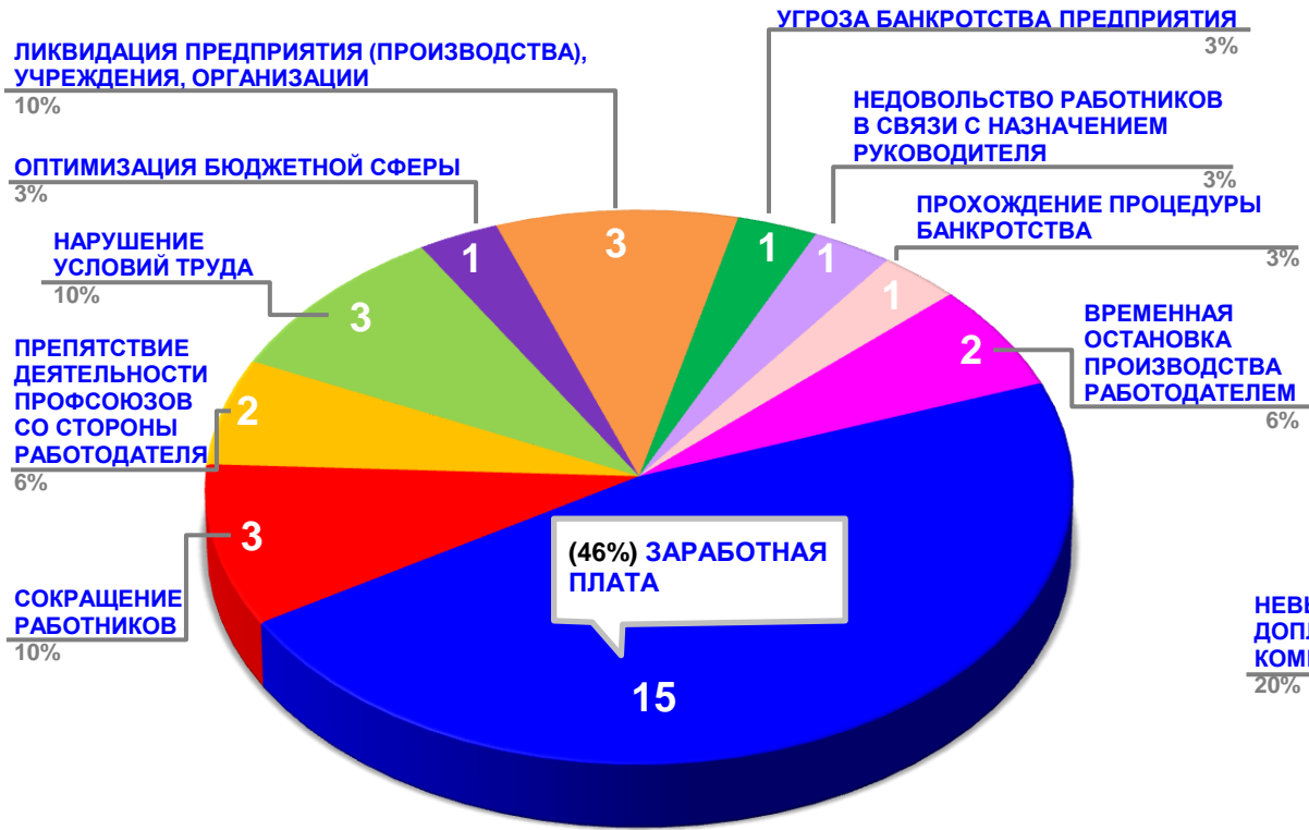
Диаграмма 3. Причины актуальных социально-трудовых конфликтов в РФ за истекшую неделю 1