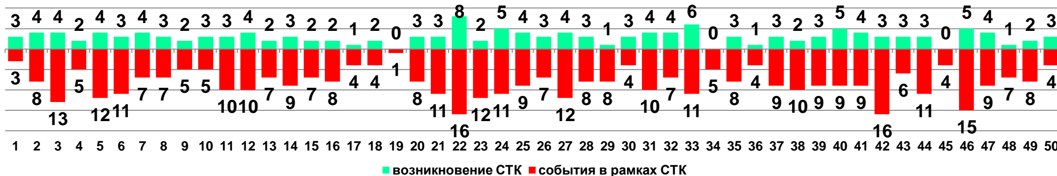
Диаграмма 1. Динамика возникновения и развития социально-трудовых конфликтов в 2017 году в недельном разрезе