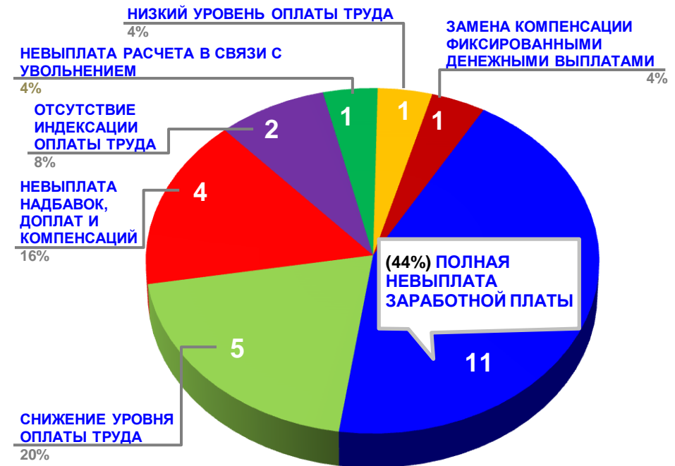
Диаграмма 4. Причины актуальных социально-трудовых конфликтов (разбивка по заработной плате)