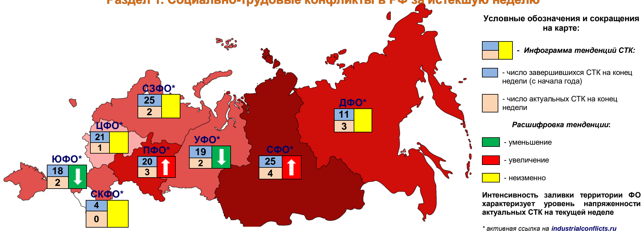
Рис. 1. Распределение СТК по федеральным округам

По состоянию на 17.12.17 на территории РФ актуальны 17 социально-трудовых конфликтов (СТК), которые развиваются в семи федеральных округах, из них 3 СТК в моногородах: ООО «Кингкоул Юг» (г.Гуково, Ростовская обл., ЮФО), ООО «Лермонтовский ГОК» (п.Светлогорье, Приморский край, ДФО), ОАО «НПК Уралвагонзавод» (г.Нижний Тагил, Свердловская обл., УФО). Распределение СТК по ФО отображено на рис.1. В наблюдаемом периоде зарегистрированы новые СТК в ПФО и СФО, которые начались по причине невыплаты заработной платы и протекают в форме забастовок (раздел 4). В Саратове (ПФО) уборщицы клининговой компании «Политэк» объявили забастовку по причине долгов по заработной плате ( www.industrialconflicts.ru ). В Новосибирске (СФО) строители ООО «СитиСтрой» в знак протеста против невыплаты заработной платы в отчаянии забрались на башенный кран и потребовали от руководства компании немедленно погасить долги ( www.industrialconflicts.ru ). Работники ЗАО «Бердский элеватор» (Новосибирская обл., СФО) объявили «итальянскую» забастовку по причине долгов по заработной плате ( www.industrialconflicts.ru ). В Новосибирске водители муниципального транспорта ООО «СИБНИКМА» провели однодневную забастовку по причине задержки заработной платы и низкого уровня оплаты труда ( www.industrialconflicts.ru ). В 2017 году НМЦ «ТК», в ходе развития СТК, было зарегистрировано пятьдесят четыре забастовки, которые в основном начинались по причинам невыплаты и задержки заработной платы.