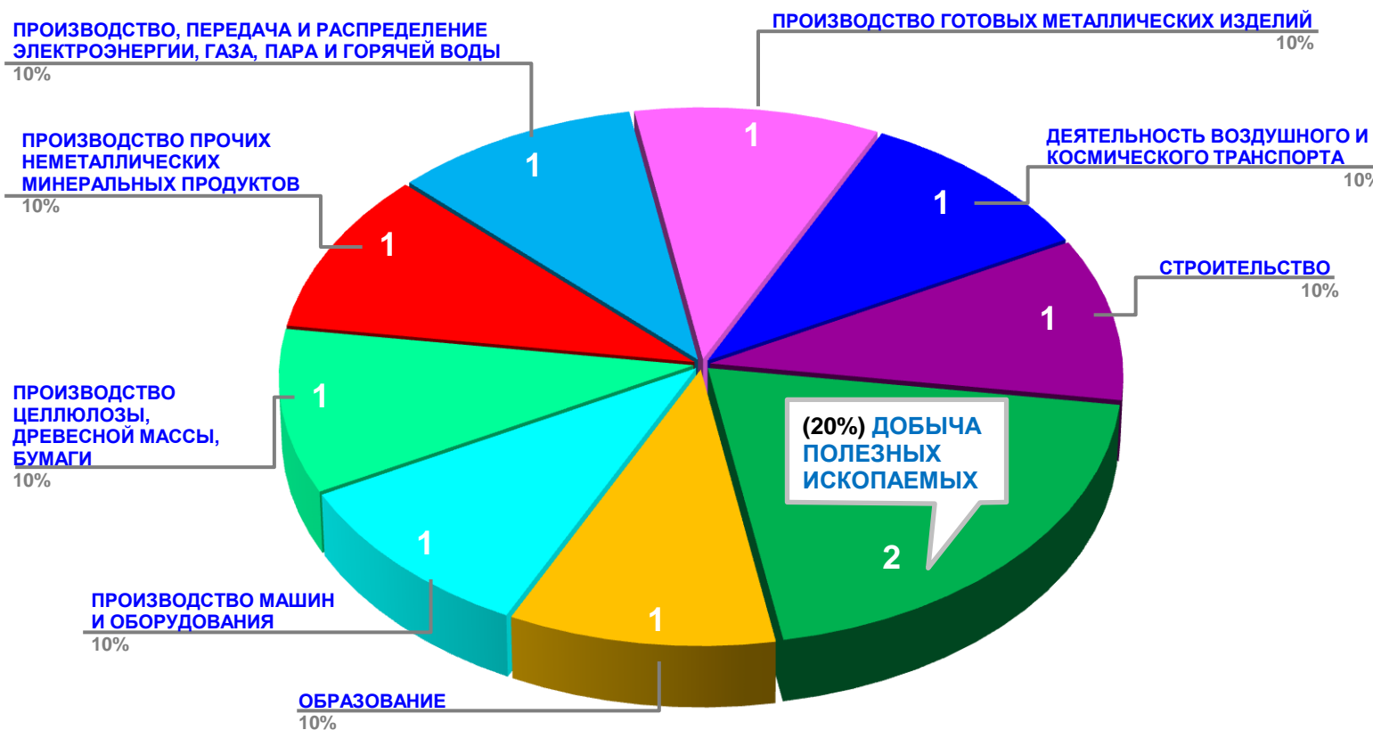
Диаграмма 2. Распределение актуальных социально-трудовых конфликтов по отраслям в РФ за истекшую неделю