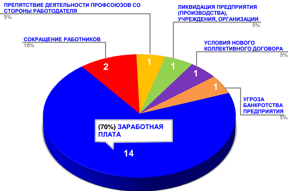
Диаграмма 3. Причины актуальных социально-трудовых конфликтов в РФ за истекшую неделю 1