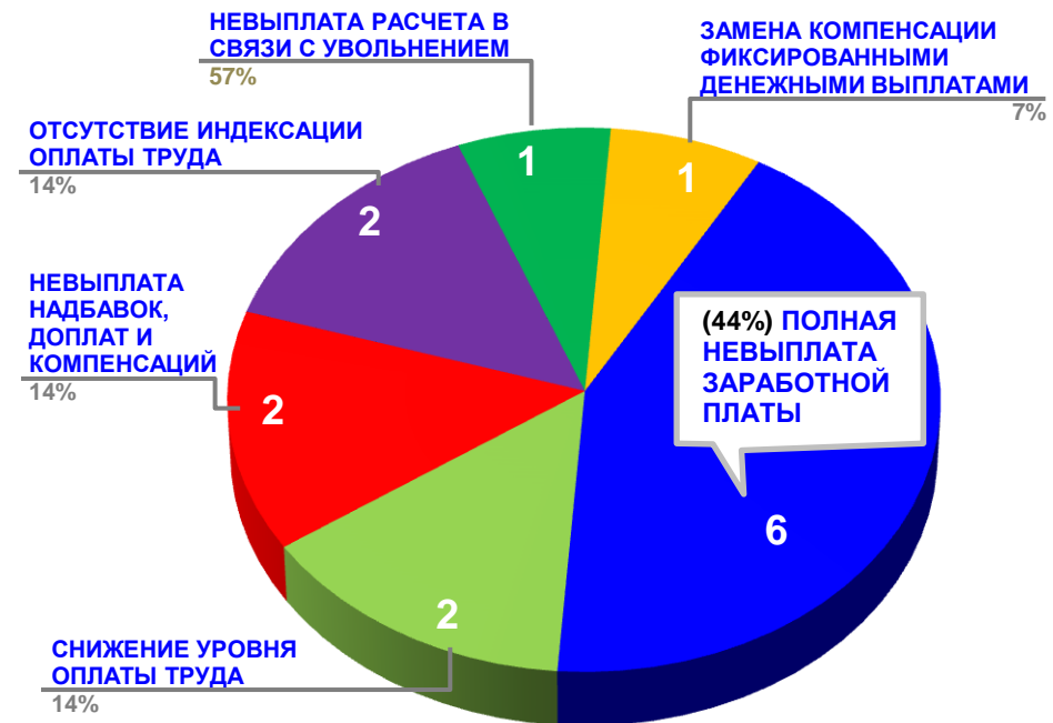
Диаграмма 4. Причины актуальных социально-трудовых конфликтов (разбивка по заработной плате)