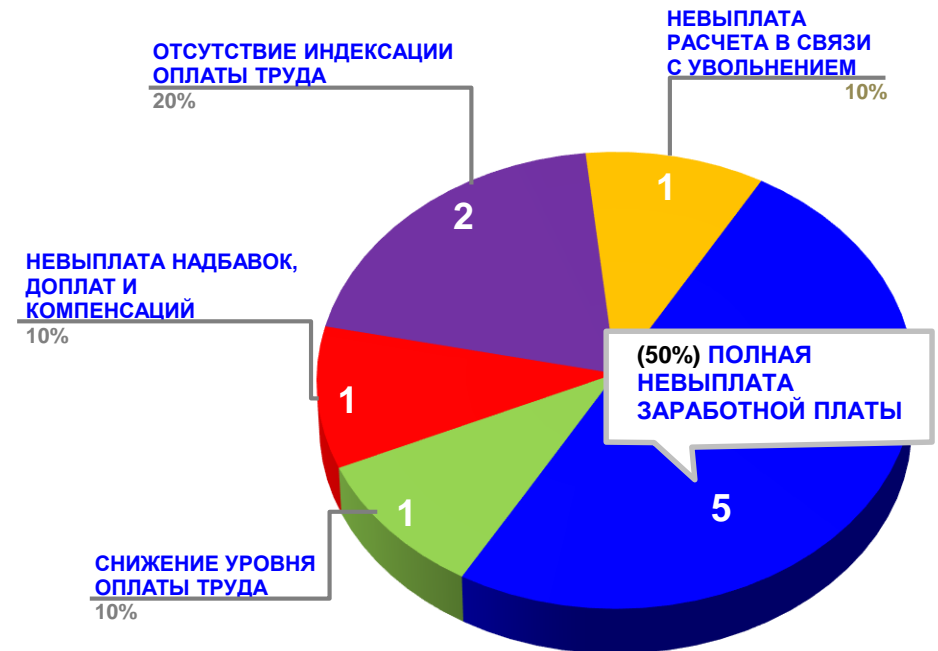
Диаграмма 4. Причины актуальных социально-трудовых конфликтов (разбивка по заработной плате)