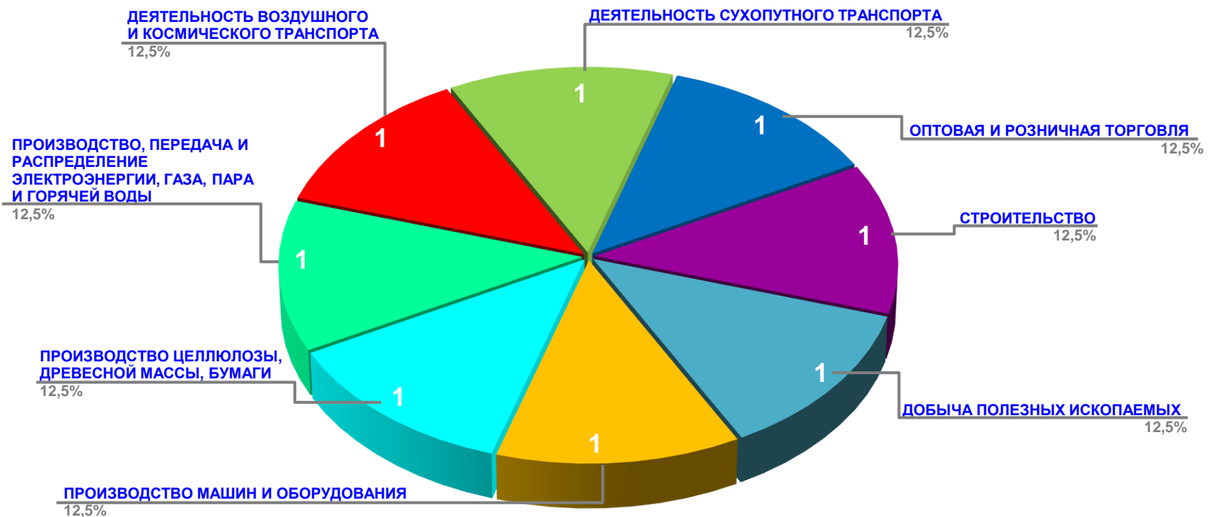
Диаграмма 2. Распределение актуальных социально-трудовых конфликтов по отраслям в РФ за истекшую неделю