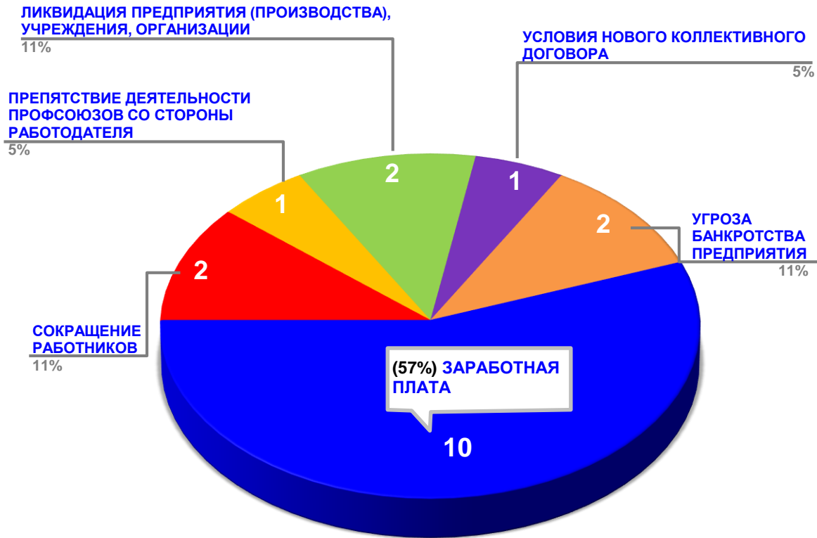
Диаграмма 3. Причины актуальных социально-трудовых конфликтов в РФ за истекшую неделю 1