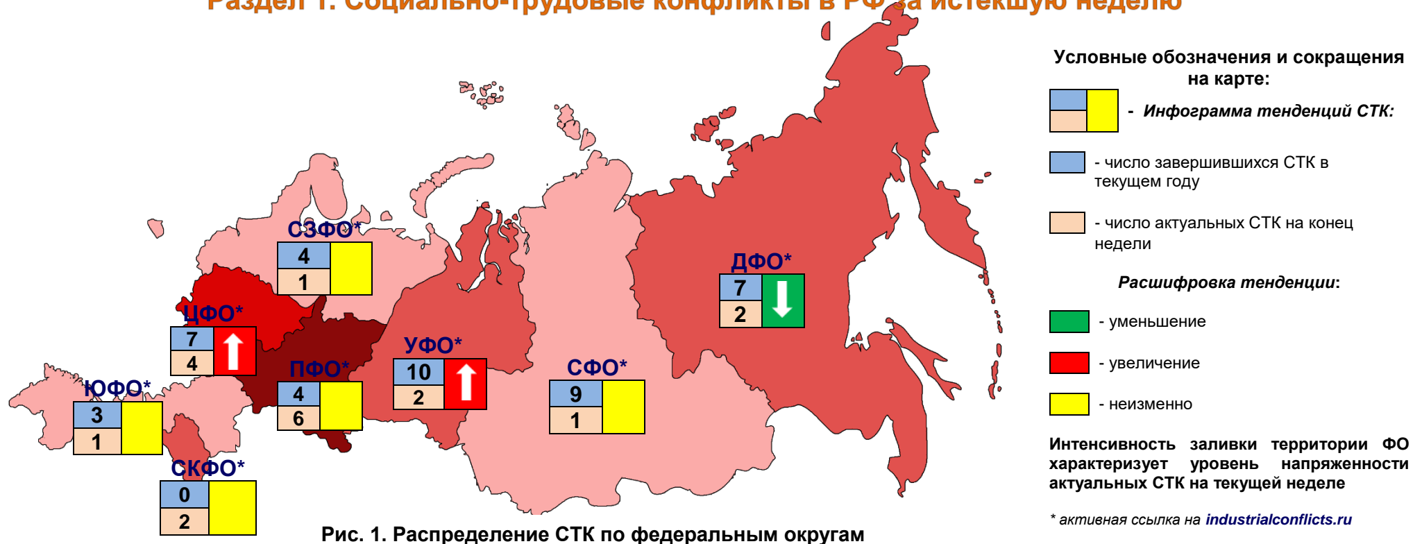
Рис. 1. Распределение СТК по федеральным округам

По состоянию на 03.06.18 на территории РФ актуальны 19 социально-трудовых конфликтов (СТК), которые развиваются в восьми федеральных округах, из них 2 СТК в моногородах: ООО «Тейский рудник» (п. Вершина Теи, республика Хакасия), ООО «Кингкоул Юг» (г. Гуково, Ростовская обл., ЮФО). Распределение СТК по ФО отображено на рис.1. В наблюдаемом периоде зарегистрированы новые СТК в ЦФО и УФО (раздел 3). Зарегистрирован второй 2018 году СТК, в котором сторона работников представлена трудовыми мигрантами: около 50 граждан из Киргизии, работников клининговой компании ООО «Мой город» (Москва, ЦФО), вышли на митинг с требованиями погашения долгов по заработной плате за три месяца. После проведения митинга в Государственную службу миграции при правительстве Кыргызской Республики были направлены заявления с просьбой оказать помощь по защите трудовых прав работников ( www.industrialconflicts.ru ). Медицинские работники Шадринской больницы СМП (Курганская обл., УФО) готовы выйти на забастовку против нарушений при начислении зарплаты медсестрам и акушеркам, отсутствия заключенных трудовых договоров и давления со стороны руководства учреждения ( www.industrialconflicts.ru ). В моногороде второй категории п. Вершина Теи (республика Хакасия, СФО) после угроз о начале протестных действий, работники обанкротившемся ООО «Тейский рудник» начали забастовку по причине невыплаты заработной платы сроком более двух месяцев ( www.industrialconflicts.ru ).