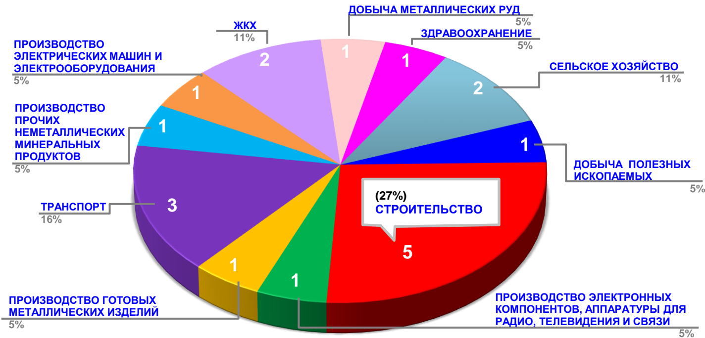
Диаграмма 2. Распределение актуальных социально-трудовых конфликтов по отраслям в РФ за истекшую неделю