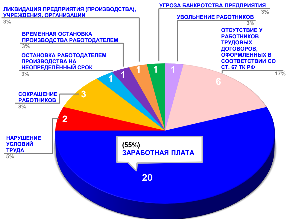
Диаграмма 3. Причины актуальных социально-трудовых конфликтов в РФ за истекшую неделю 1