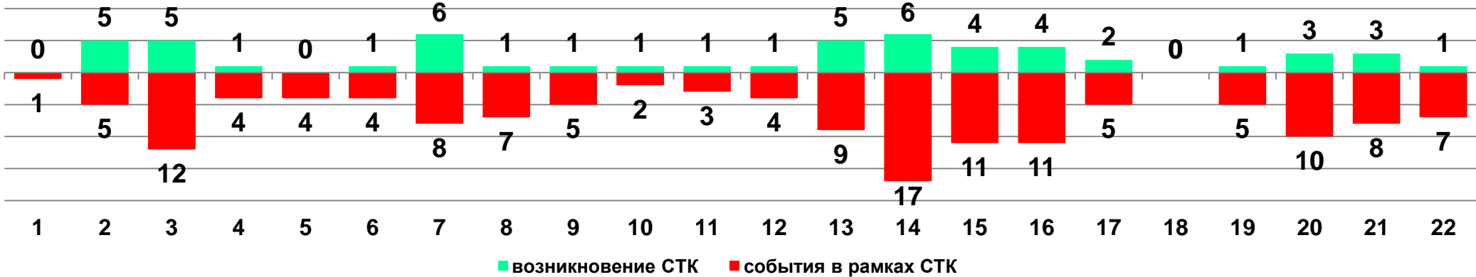
Диаграмма 1. Динамика возникновения и развития социально-трудовых конфликтов в 2018 году в недельном разрезе