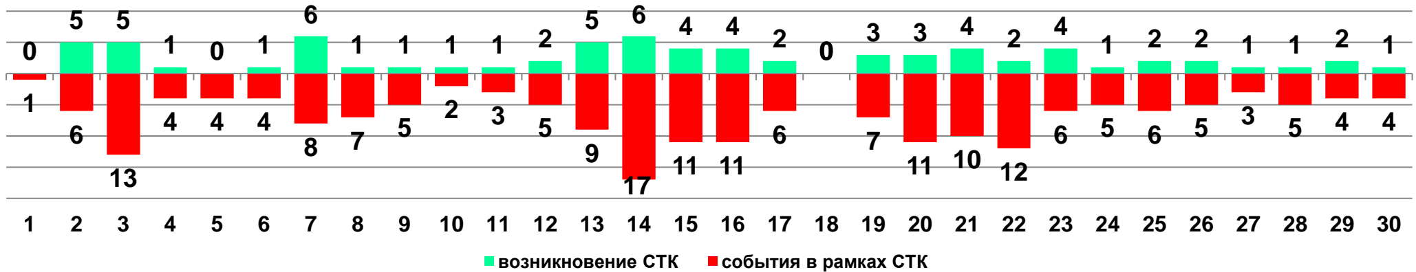
Диаграмма 1. Динамика возникновения и развития социально-трудовых конфликтов в 2018 году в недельном разрезе