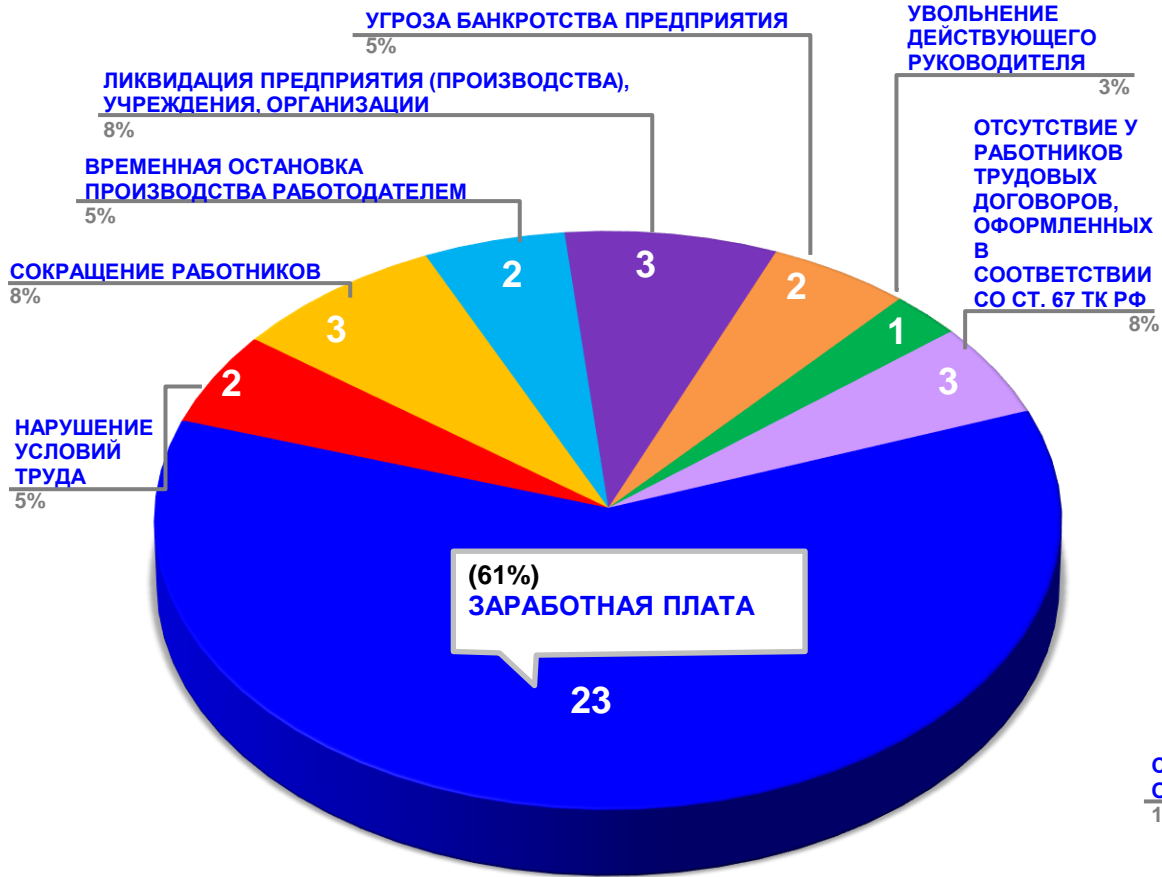
Диаграмма 3. Причины актуальных социально-трудовых конфликтов в РФ за истекшую неделю 1