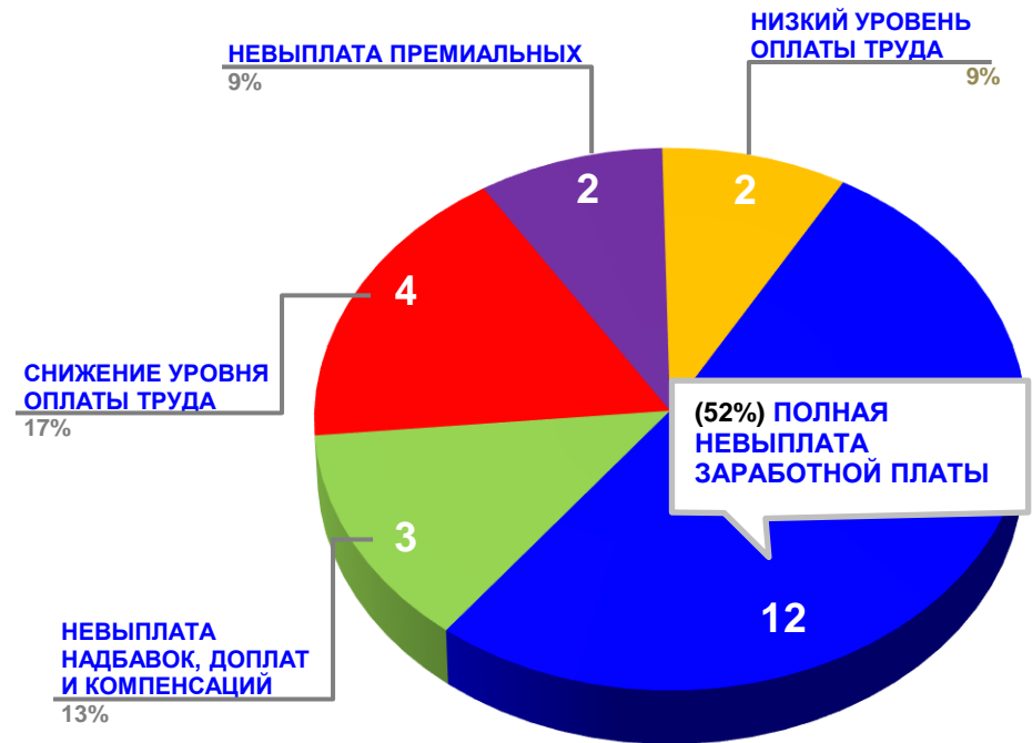
Диаграмма 4. Причины актуальных социально-трудовых конфликтов (разбивка по заработной плате)