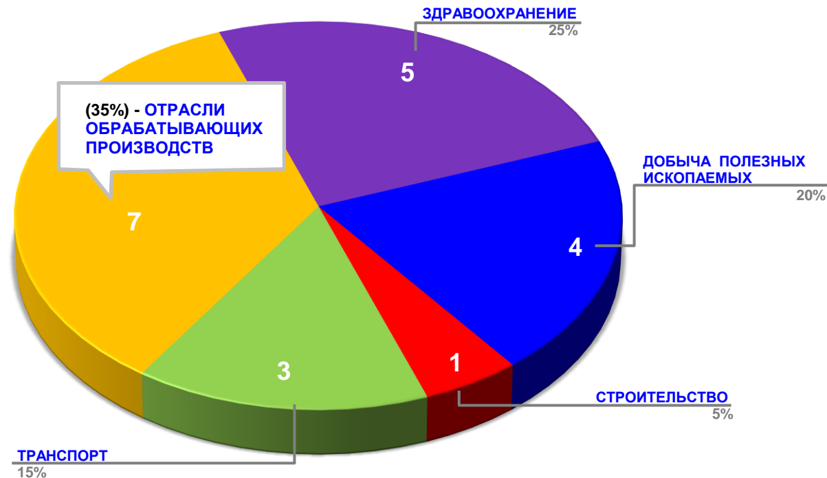
Диаграмма 2. Распределение актуальных социально-трудовых конфликтов по отраслям в РФ за истекшую неделю