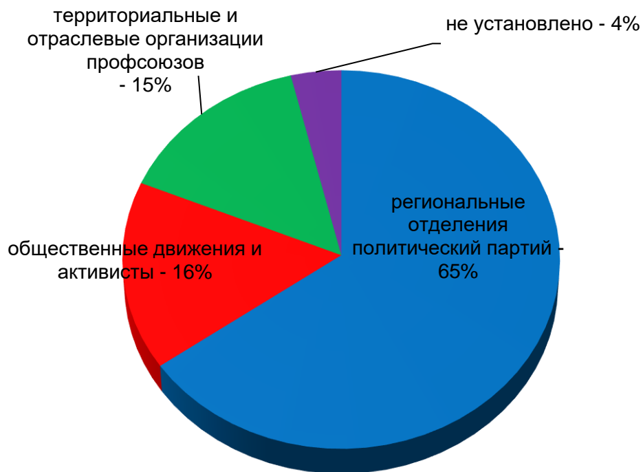
Диаграмма 9. Организаторы протестных действий

Организаторами общественных протестных мероприятий выступают региональные отделения политических партий (65%), территориальные и отраслевые организации профсоюзных центров (15%), общественные организации и движения (16%) (Диаграмма 9).