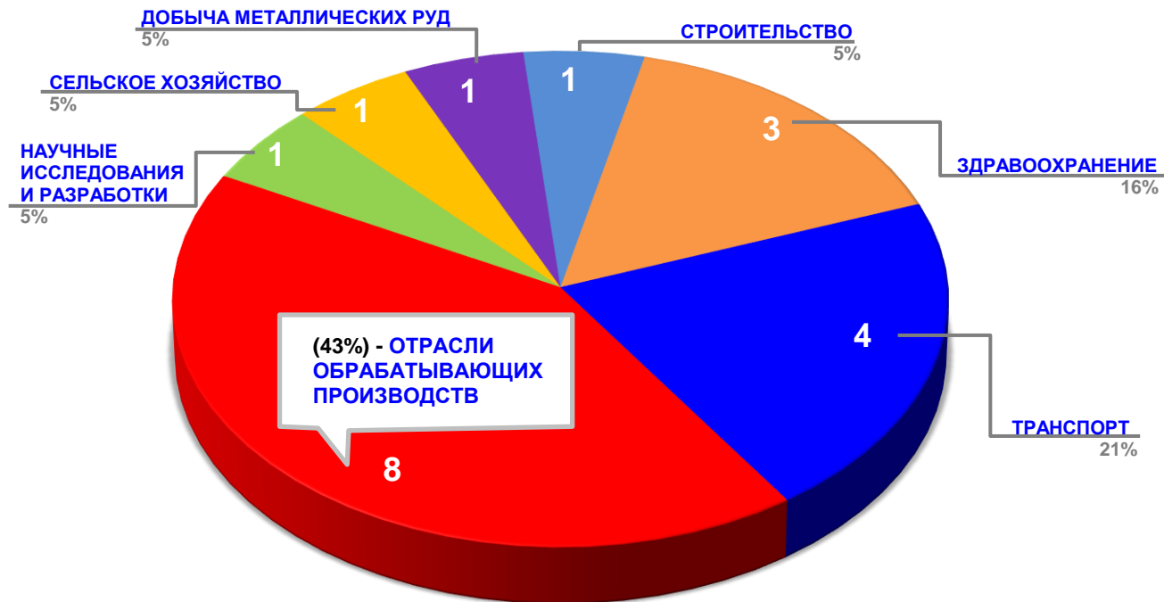
Диаграмма 2. Распределение актуальных социально-трудовых конфликтов по отраслям в РФ за истекшую неделю