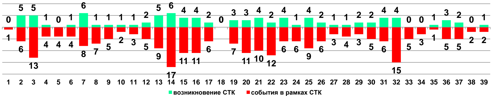
Диаграмма 1. Динамика возникновения и развития социально-трудовых конфликтов в 2018 году в недельном разрезе