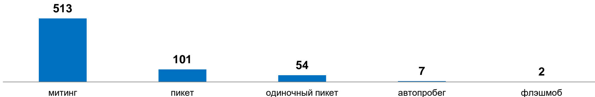
Диаграмма 8. Применяемые формы протестных действий

Всего НМЦ «ТК» на данный момент зарегистрировано более 670 акций протеста, по сообщениям СМИ и обобщенными автоматизированной системой сбора и обработки центра (Диаграмма 8).