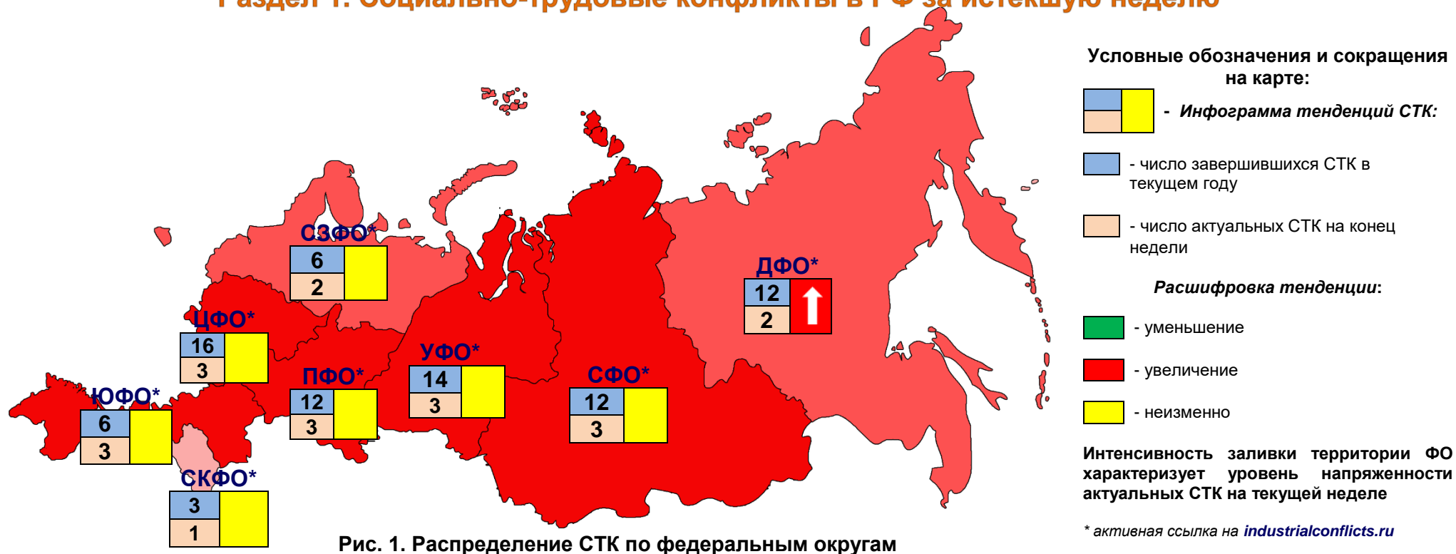
Рис. 1. Распределение СТК по федеральным округам

По состоянию на 30.09.18 на территории РФ актуальны 20 социально-трудовых конфликтов (СТК), которые развиваются в восьми федеральных округах, из них 2 СТК в моногородах: ООО «Тейский рудник» (п. Вершина Теи, республика Хакасия, СФО), ООО «Кингкоул Юг» (г. Гуково, Ростовская обл., ЮФО). Распределение СТК по ФО отображено на рис.1. В наблюдаемом периоде новые СТК зарегистрированы в УФО и СФО (раздел 3).