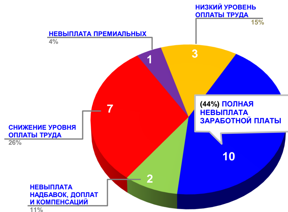
Диаграмма 4. Причины актуальных социально-трудовых конфликтов (разбивка по заработной плате)