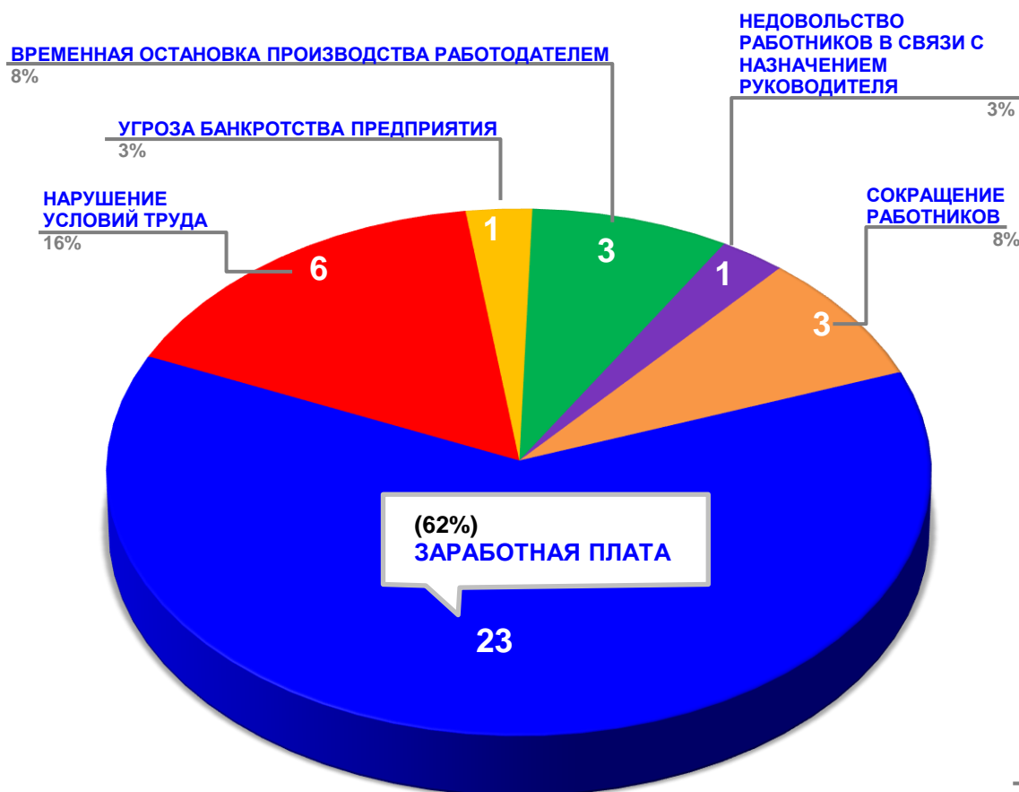
Диаграмма 3. Причины актуальных социально-трудовых конфликтов в РФ за истекшую неделю 1