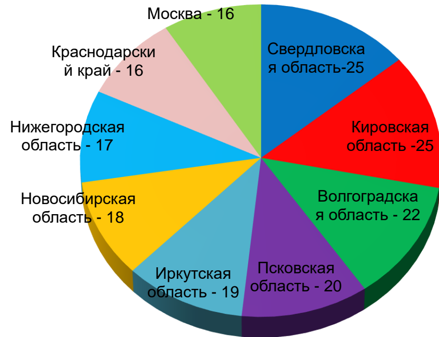
Диаграмма 7. Субъекты РФ с наибольшим количеством проведенных акций протеста

За этот период митинги, пикеты и другие акции были зарегистрированы во всех федеральных округах без исключения (Диаграмма 6). Наибольшее количество протестных акций состоялось в ПФО (146), ЦФО (114), СФО (111). Протестные мероприятия проходили в 83 субъектах РФ. Регионы, в которых состоялось наибольшее количество акций протеста, показано на Диаграмме 7.