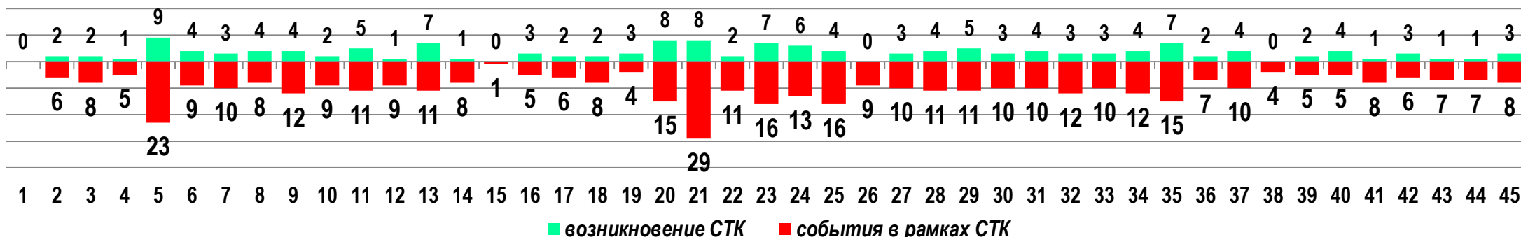
Диаграмма 1. Динамика возникновения и развития СТК в 2020 году в недельном разрезе