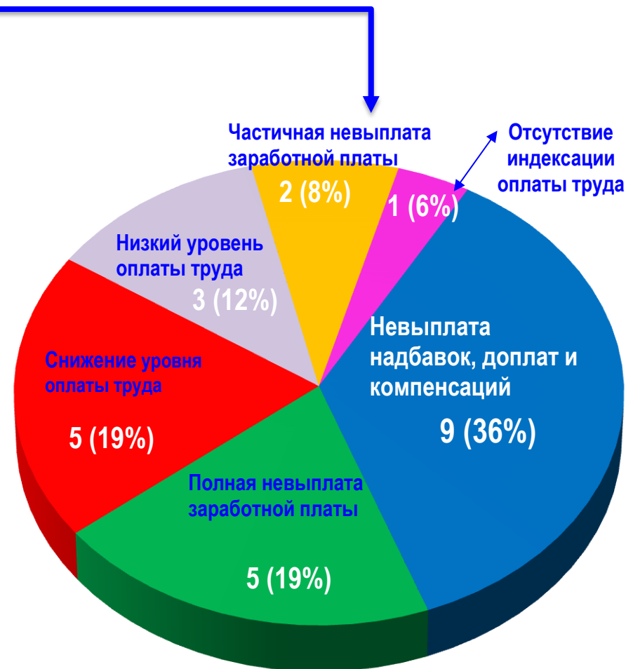
Диаграмма 4. Причины актуальных СТК (разбивка по заработной плате)