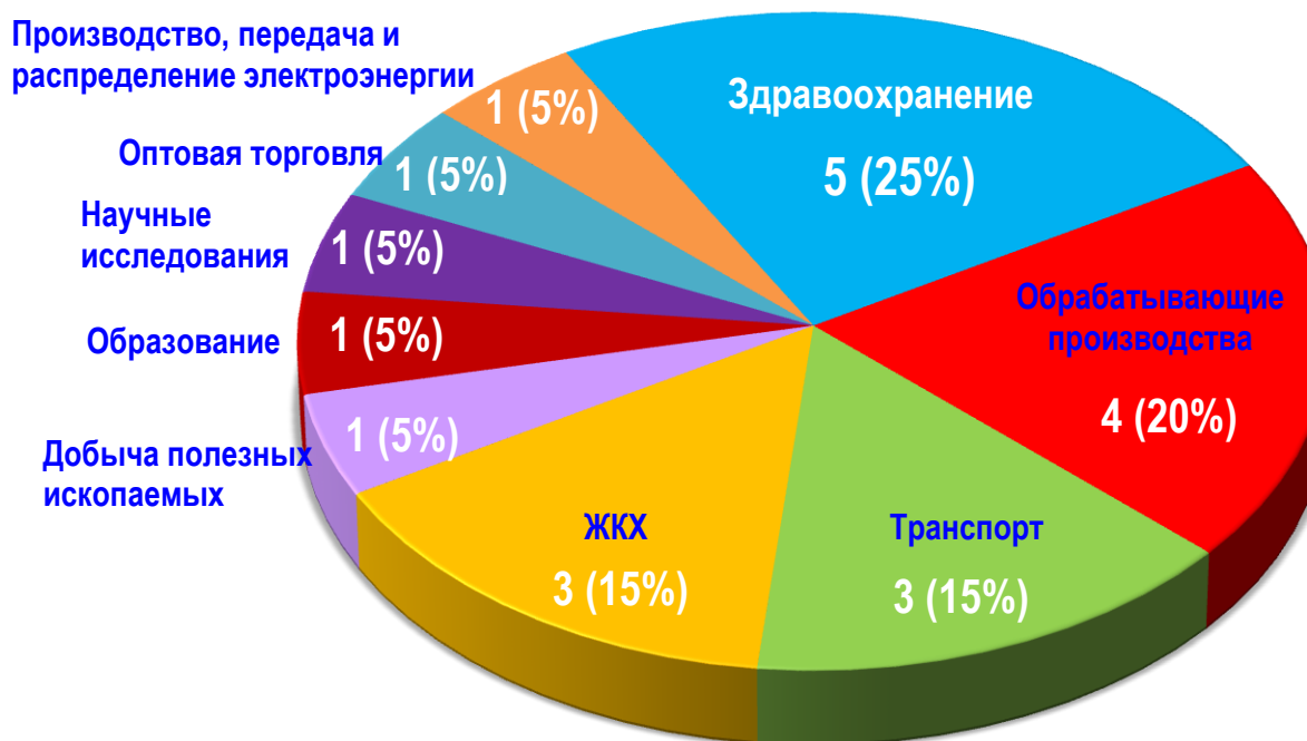
Диаграмма 2. Распределение актуальных СТК по отраслям за истекшую неделю