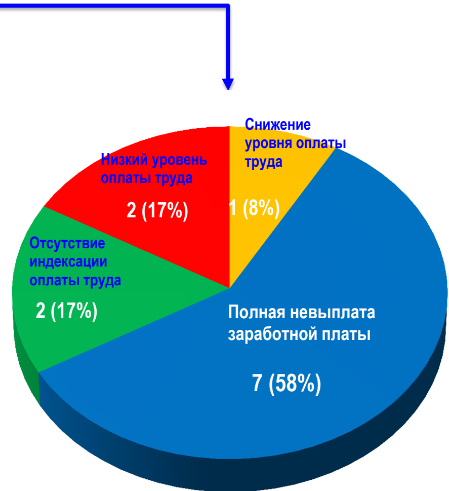
Диаграмма 4. Причины актуальных СТК (разбивка по заработной плате)