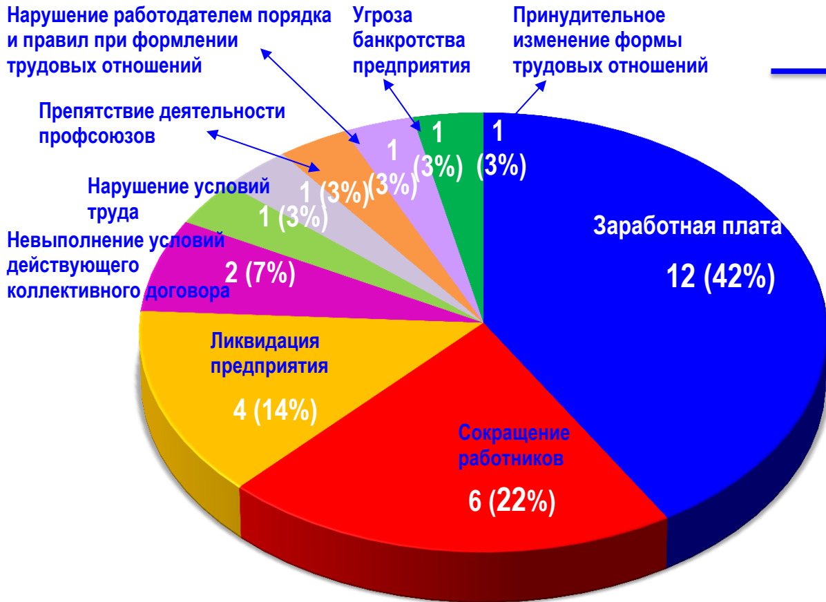
Диаграмма 3. Причины актуальных СТК за истекшую неделю 1