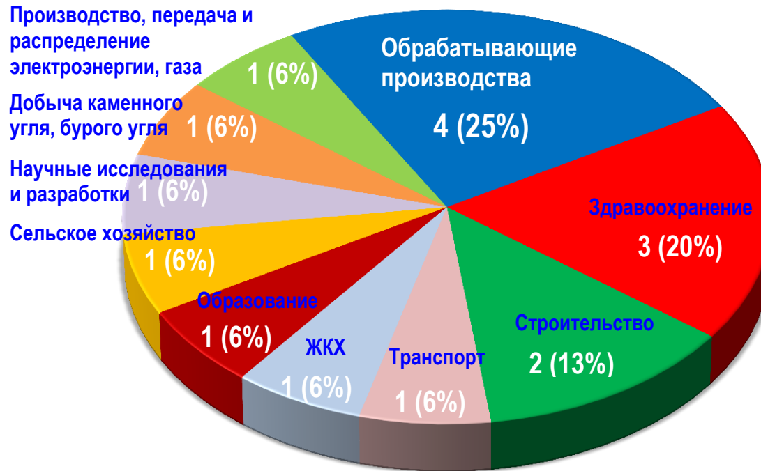
Диаграмма 2. Распределение актуальных СТК по отраслям за истекшую неделю