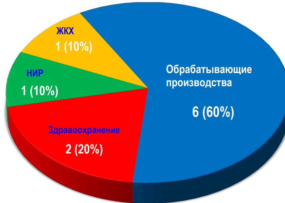
Диаграмма 2. Распределение актуальных СТК по отраслям за истекшую неделю