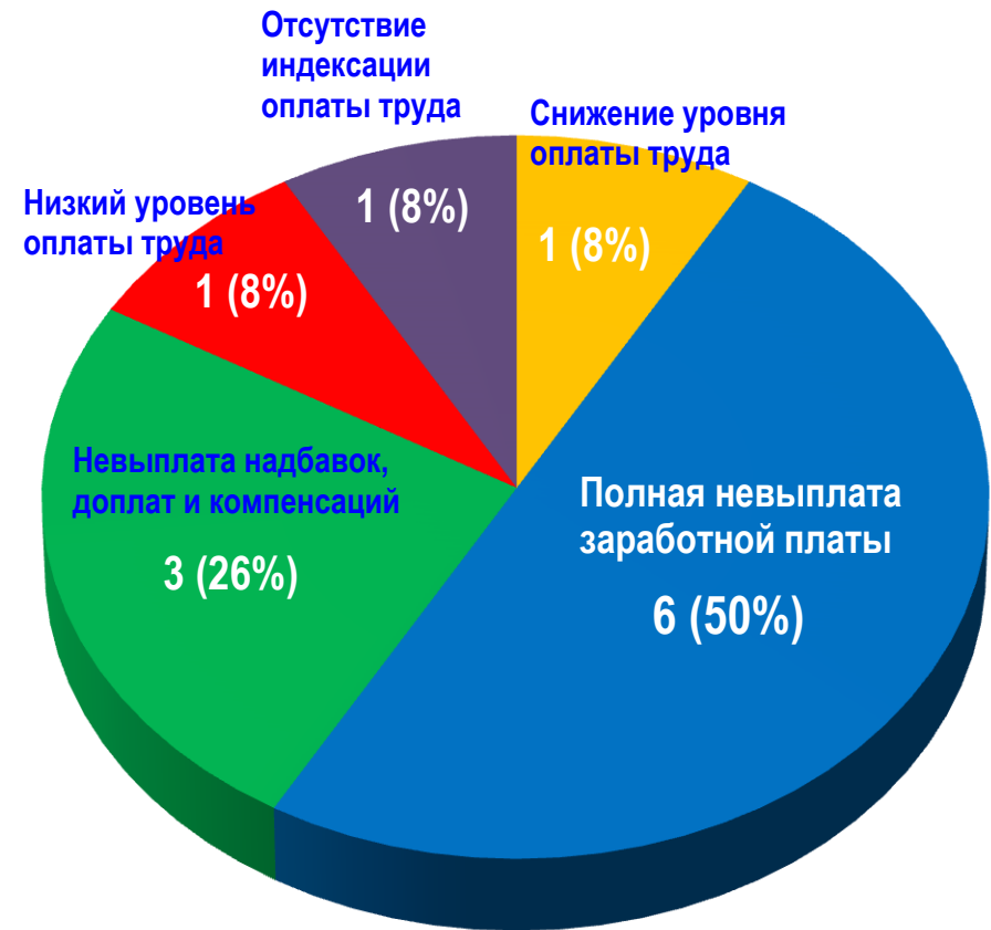
Диаграмма 4. Причины актуальных СТК (разбивка по заработной плате)