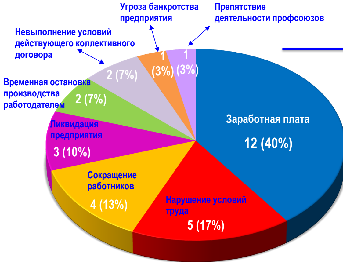
Диаграмма 3. Причины актуальных СТК за истекшую неделю 1