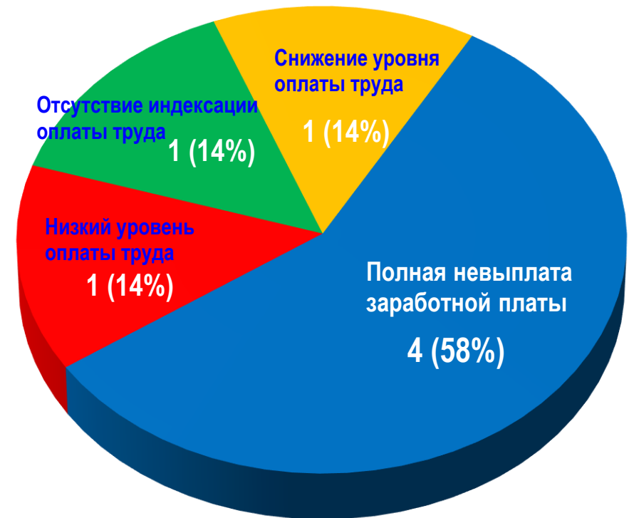
Диаграмма 4. Причины актуальных СТК (разбивка по заработной плате)