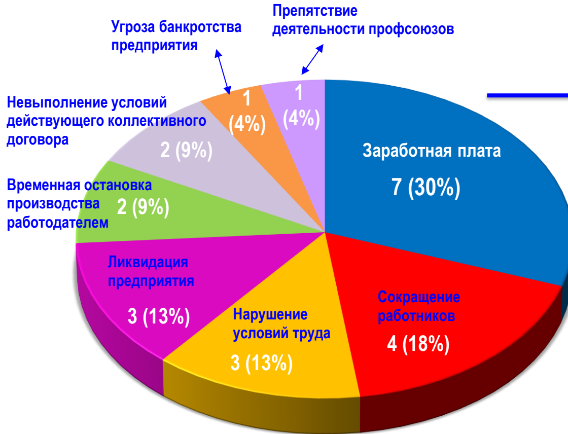
Диаграмма 3. Причины актуальных СТК за истекшую неделю 1