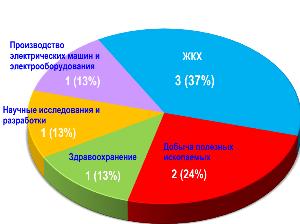
Диаграмма 1. Распределение актуальных СТК по отраслям за истекшую неделю