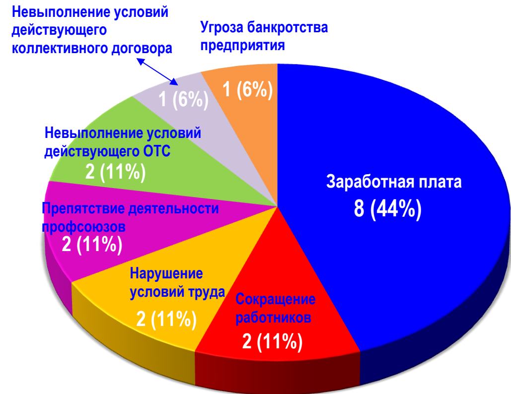
Диаграмма 2. Причины актуальных СТК за истекшую неделю 1