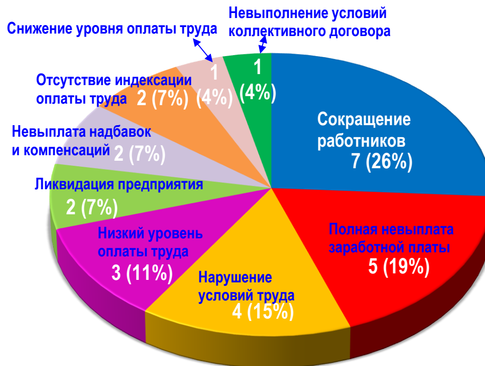
Диаграмма 3. Причины актуальных СТК за истекшую неделю 1