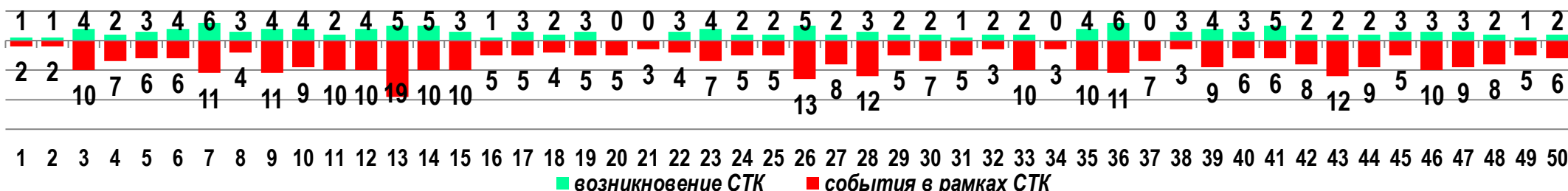
Диаграмма 1. Динамика возникновения и развития СТК в 2021 году в недельном разрезе