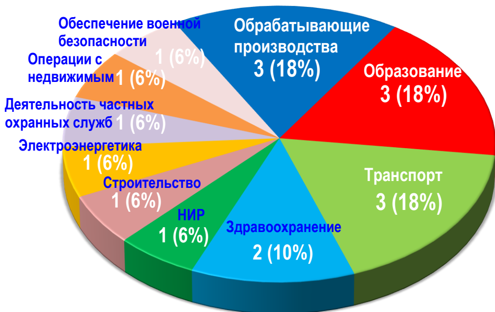
Диаграмма 2. Распределение актуальных СТК по отраслям за истекшую неделю